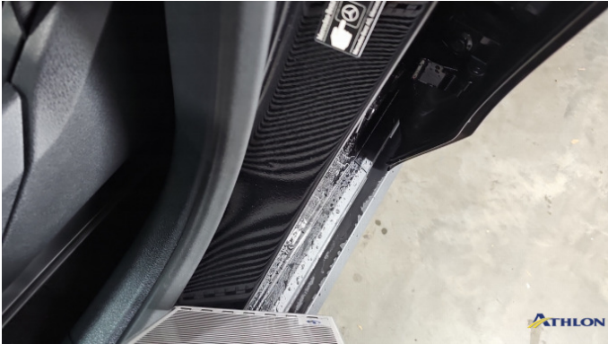
2. Türeinstieg Vorne - Links 2 Dellen