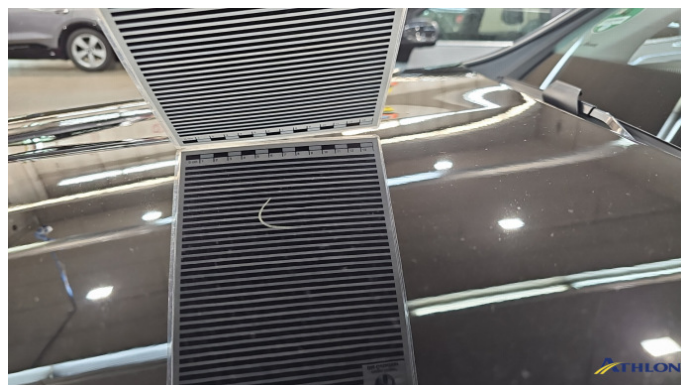
1. Motorhaube 1 Delle