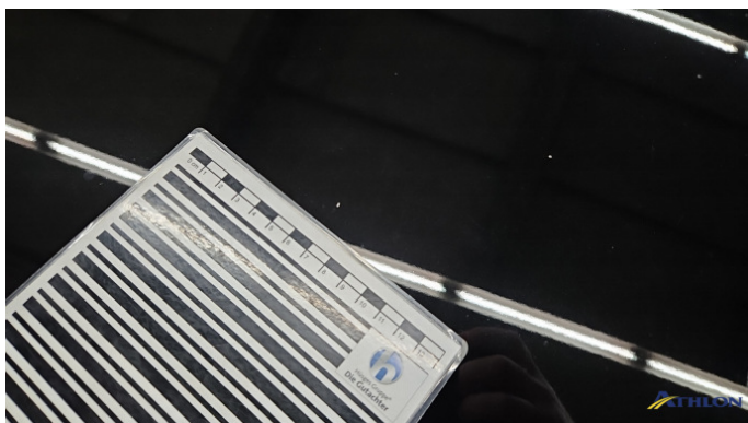
1. Motorhaube Steinschlag