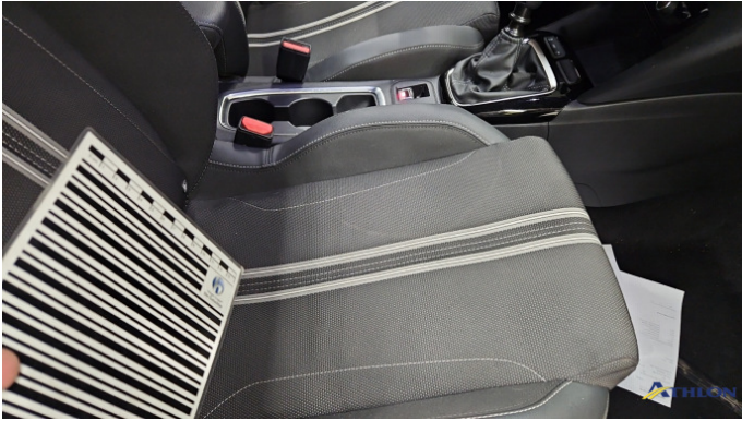
3. Sitz - Vorne - Rechts: Kissen Verschmutzt (leicht)