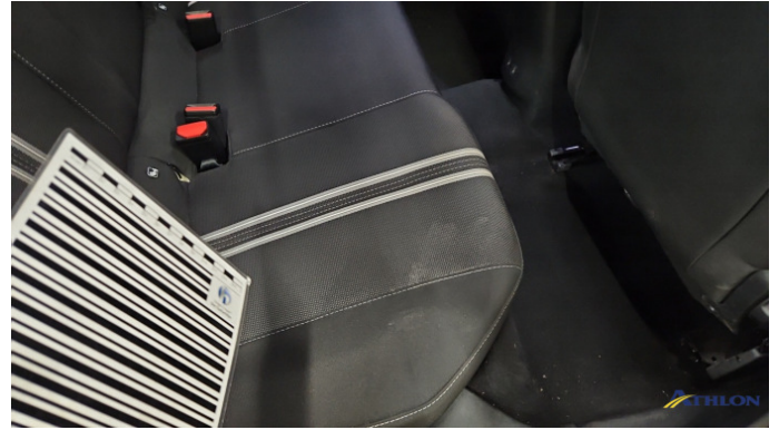
4. Sitzbank - Hinten: Kissen Verschmutzt (mittel)