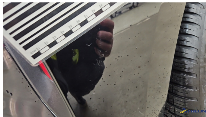
2. Stoßfänger Hinten Kratzer