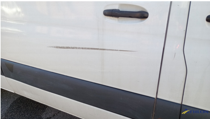
6. porta anteriore - destra Graffi superficiali