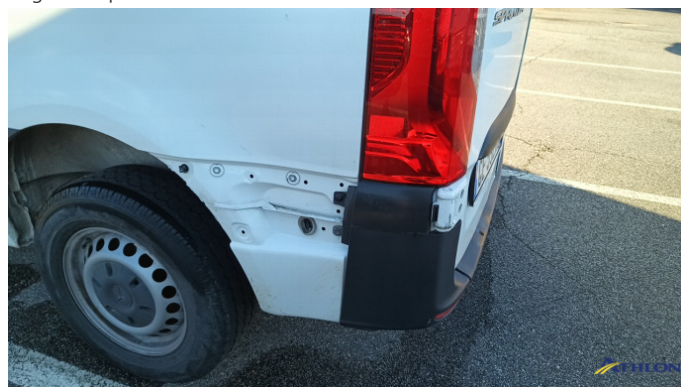
1. parete laterale - posteriore - sinistra Graffio/Rigature