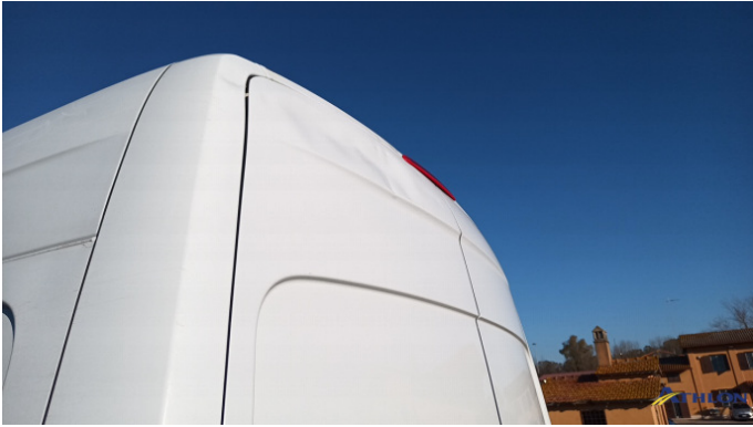
2. portello posteriore Graffio/Rigature