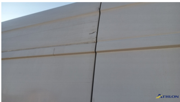
7. porta posteriore - destra Graffio/Rigature