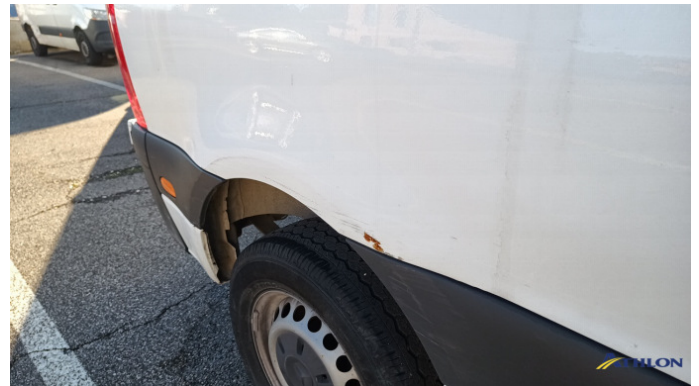
7. porta posteriore - destra Graffio/Rigature