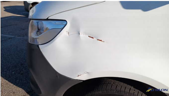
4. parafrangente anteriore - sinistro Graffio/Rigature