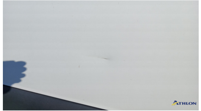
3. porta anteriore - sinistra Graffio/Rigature