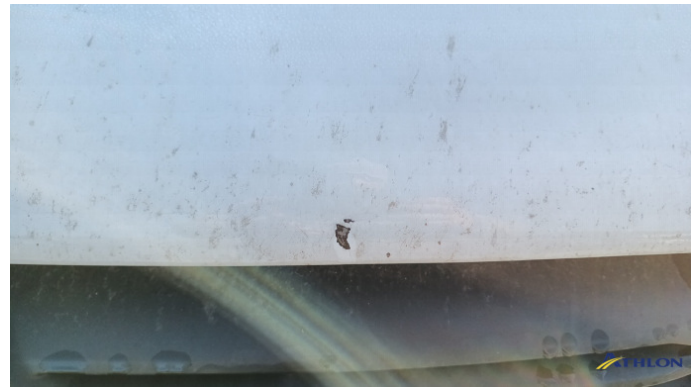
5. cofano Graffio/Rigature