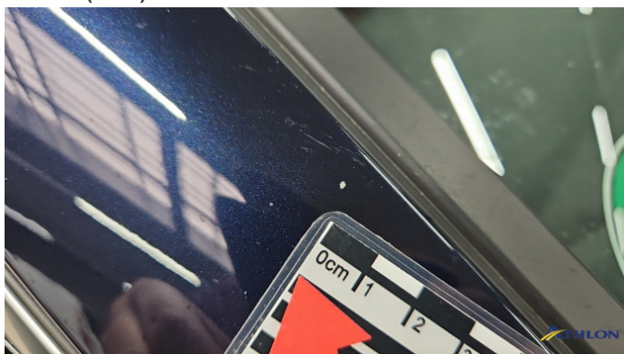
6. A-Säule Vorne - Rechts Steinschlag