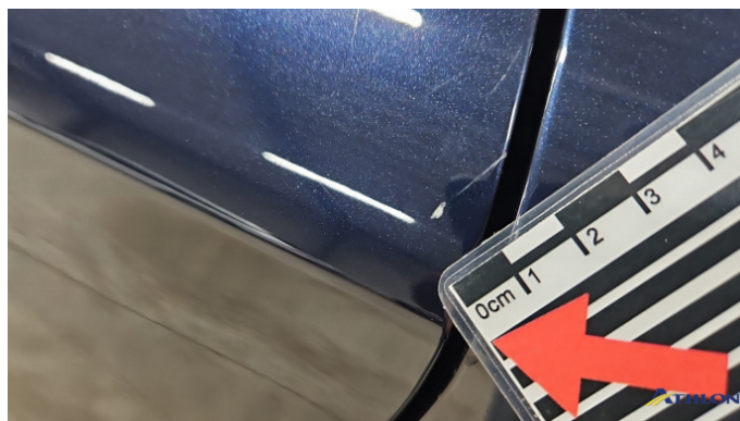
3. Tür Hinten - Links Kratzer