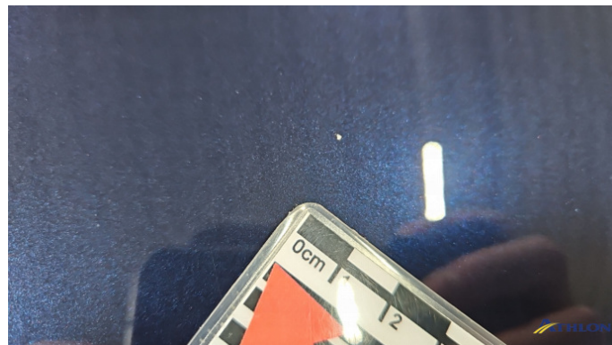
1. Motorhaube Steinschlag