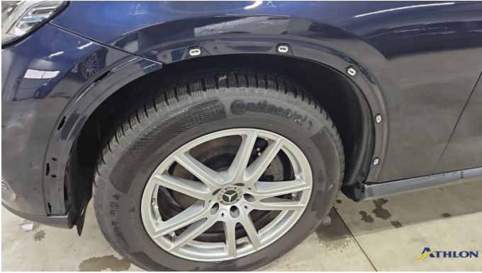
11. Zierleiste Radhauskasten Vorne Links Fehlt