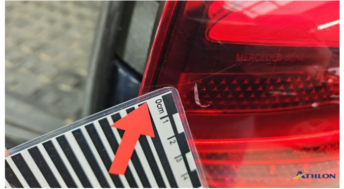
12. Rückleuchte Rechts Kratzer