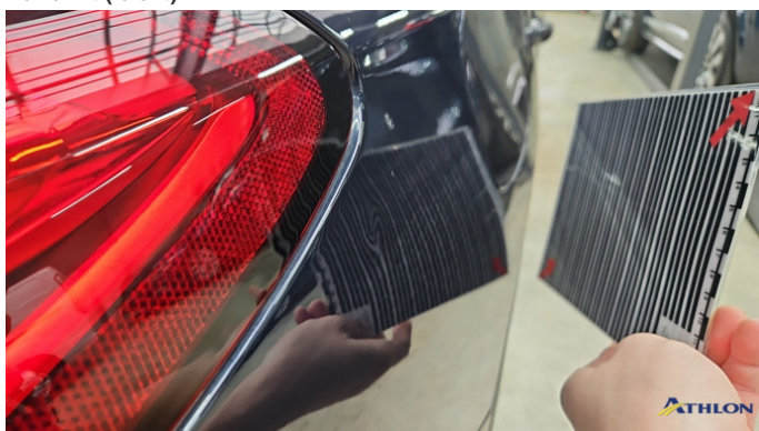
4. Seitenwand - Hinten - Rechts Verformt (leicht)