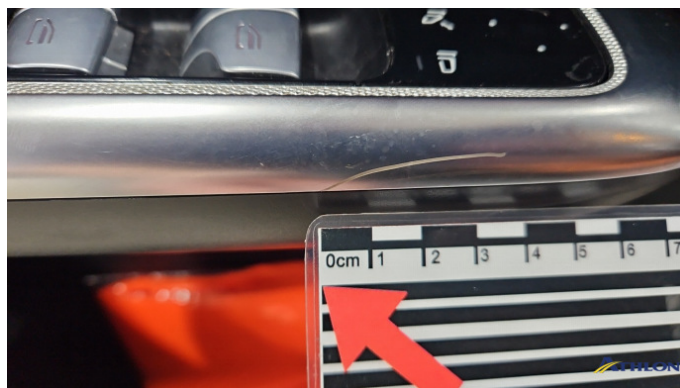
7. Türverkleidung Vorne - Links Kratzer