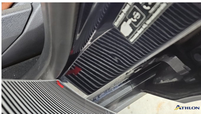
2. Türeinstieg Vorne - Links Verformt (leicht)