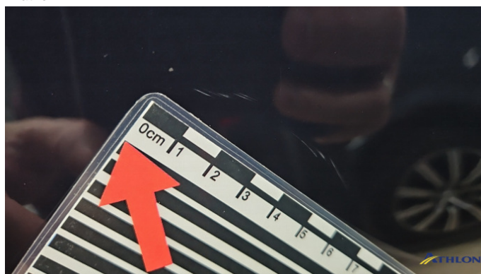
5. Kotflügel Vorne - Rechts Kratzer