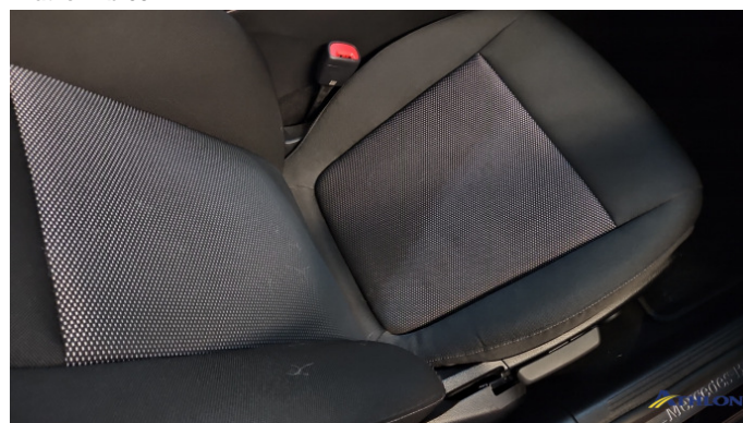
3. Sitz - Vorne - Rechts: Kissen Verschmutzt (leicht)