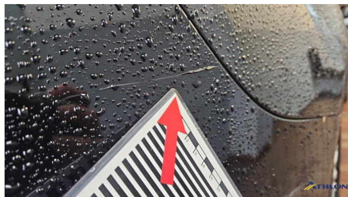
1. Stoßfänger Hinten Kratzer Ab 60mm