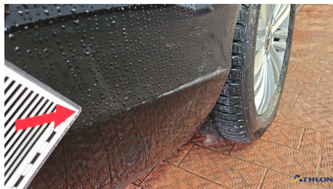
1. Stoßfänger Hinten Kratzer Ab 60mm