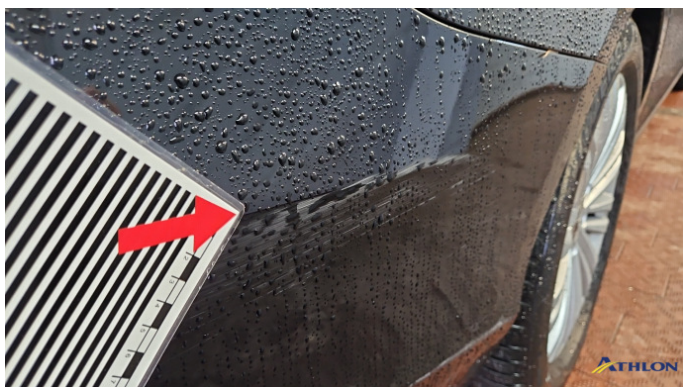
1. Stoßfänger Hinten Kratzer Ab 60mm