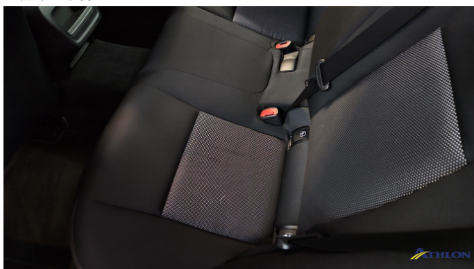
2. Sitzbank - Hinten: Kissen Verschmutzt (leicht)