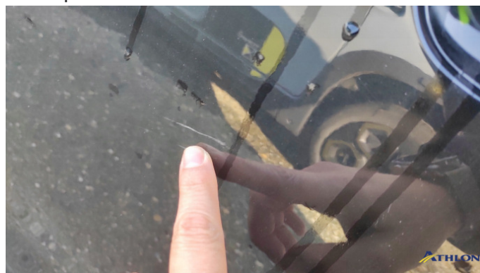
2. porta anteriore - sinistra Graffi superficiali