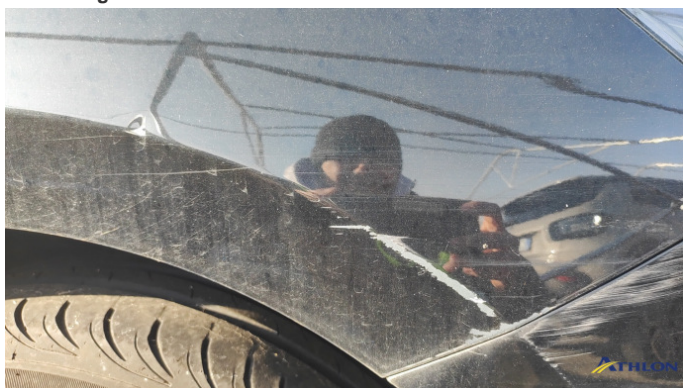
4. Parafango anteriore - destro Graffio/Rigature