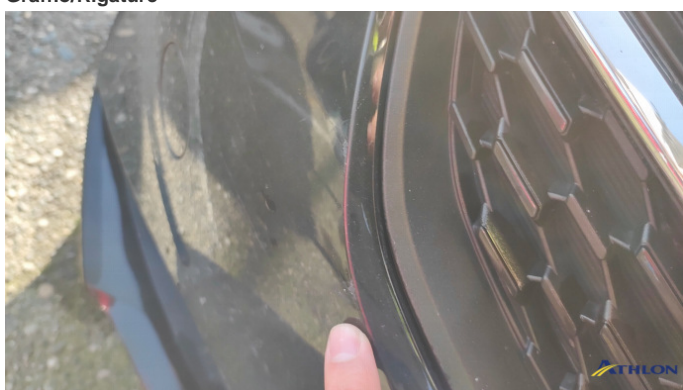
3. paraurti anteriore Graffio/Rigature