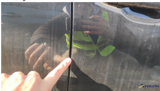
5. porta anteriore - destra Graffio/Rigature