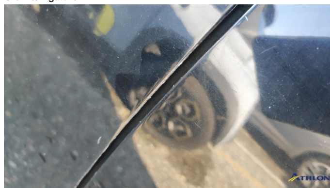
2. porta anteriore - sinistra Graffi superficiali