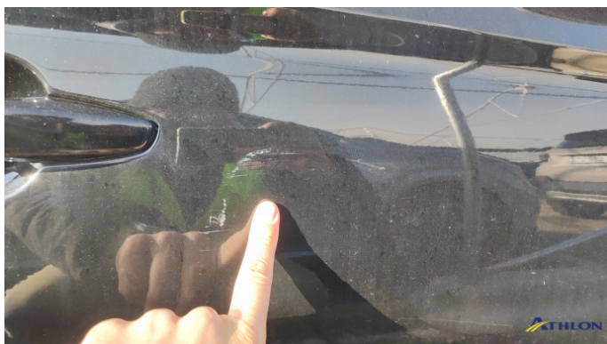
5. porta anteriore - destra Graffio/Rigature