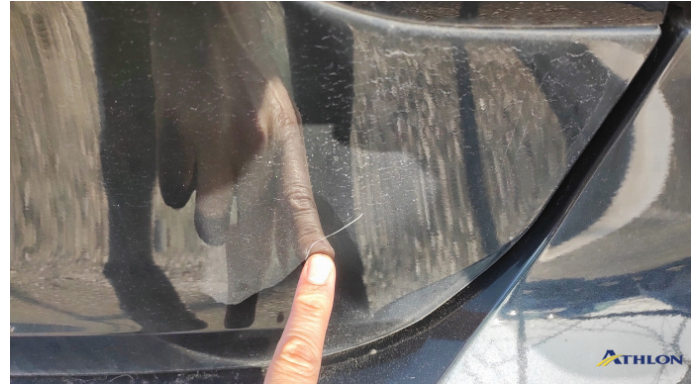
8. portello posteriore Graffio/Rigature