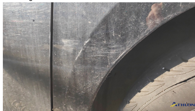
4. Parafango anteriore - destro Graffio/Rigature