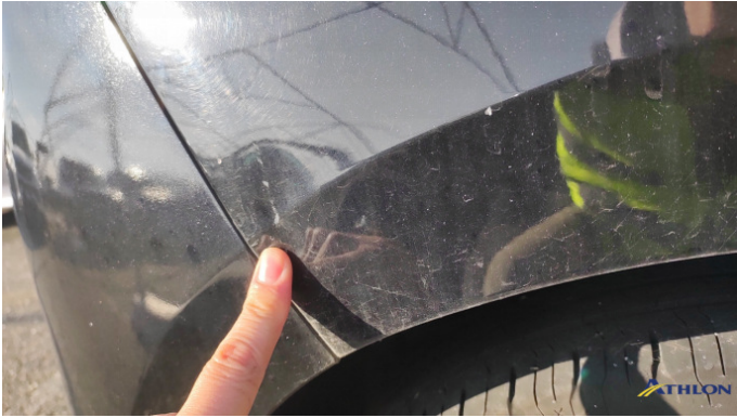
7. parete laterale - posteriore - destra 1 ammaccatura