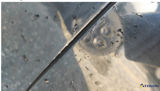
2. porta anteriore - sinistra Graffi superficiali