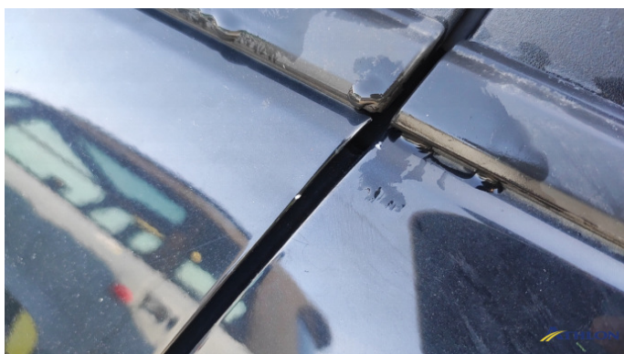
2. porta anteriore - sinistra Graffi superficiali