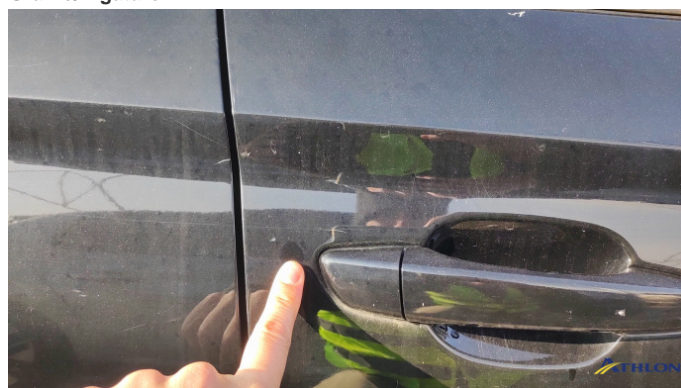
5. porta anteriore - destra Graffio/Rigature