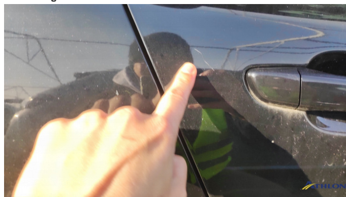
6. porta posteriore - destra Graffio/Rigature