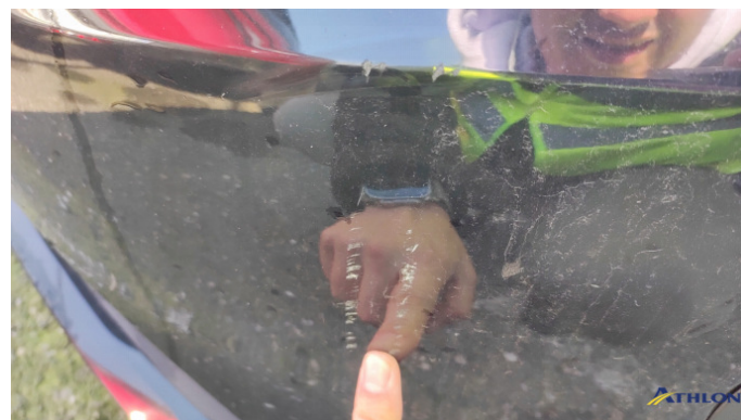
3. paraurti anteriore Graffio/Rigature