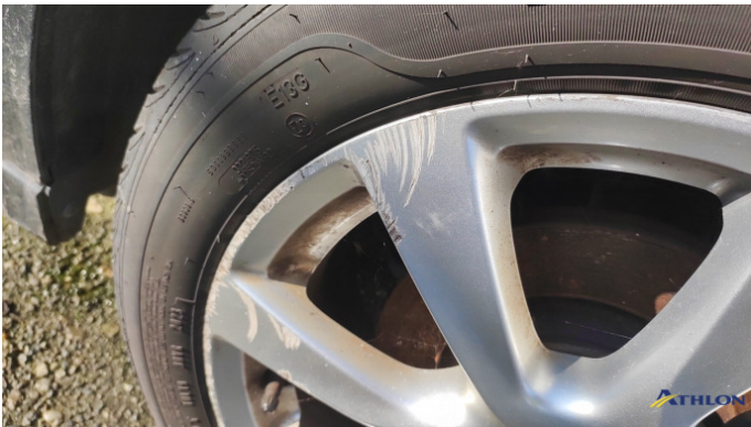
9. cerchiona anteriore - destra Graffio/Rigature