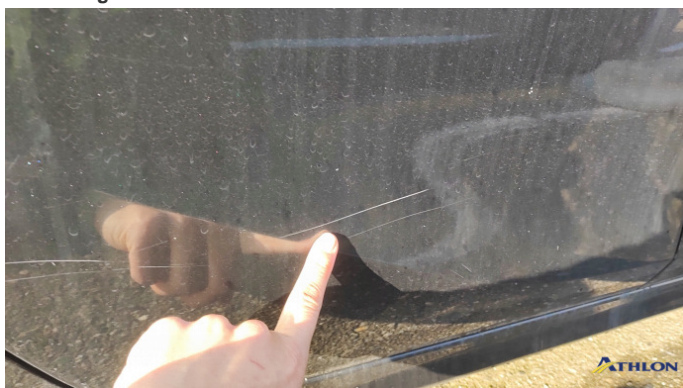
6. porta posteriore - destra Graffio/Rigature