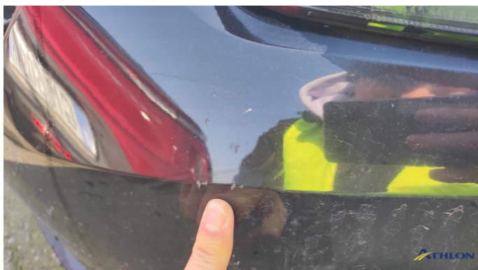
3. paraurti anteriore Graffio/Rigature