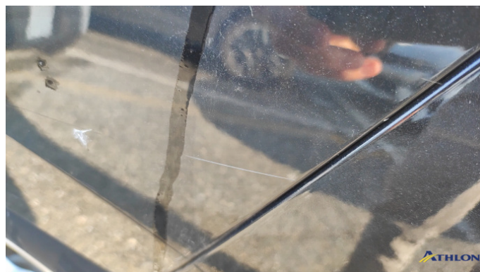
1. parete laterale - posteriore - sinistra Graffio/Rigature