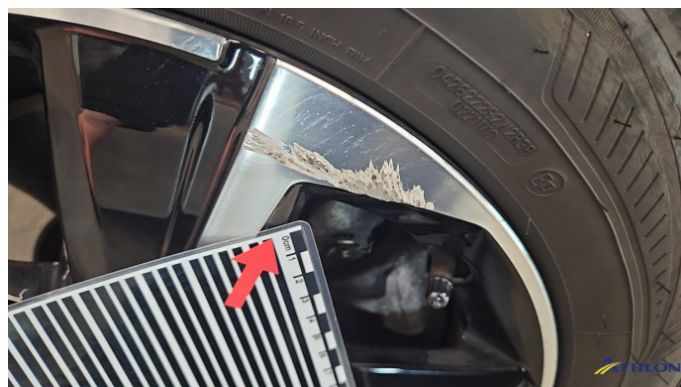
2. Felge Vorne - Rechts Beschädigt