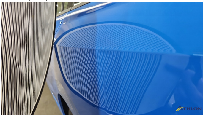
4. Seitenwand - Hinten - Links Verformt (leicht)