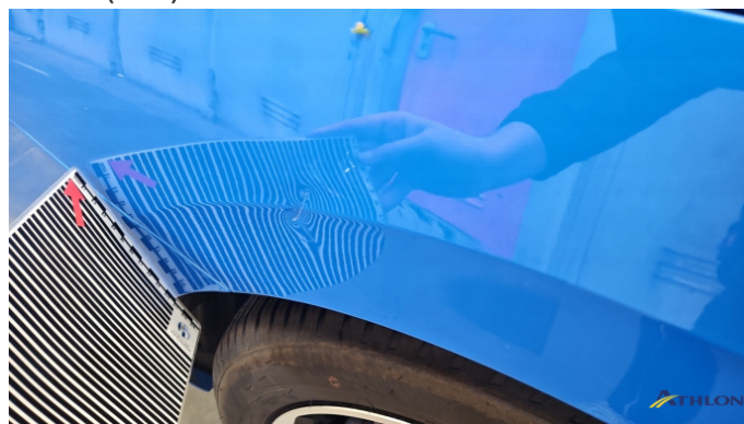
5. Seitenwand - Hinten - Rechts Verformt (leicht)