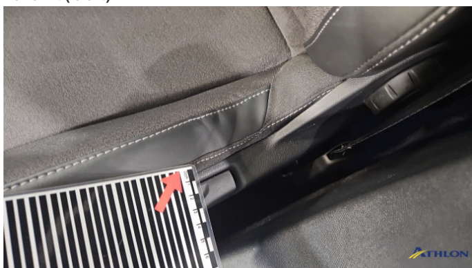
8. Sitz - Vorne - Links Gebrauchsspuren