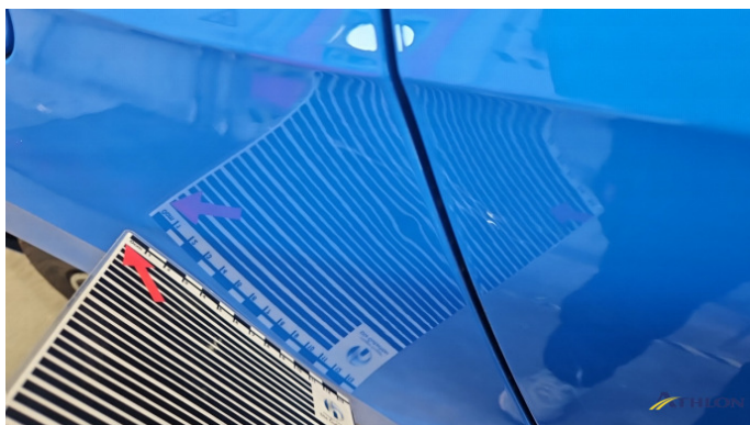
5. Seitenwand - Hinten - Rechts Verformt (leicht)