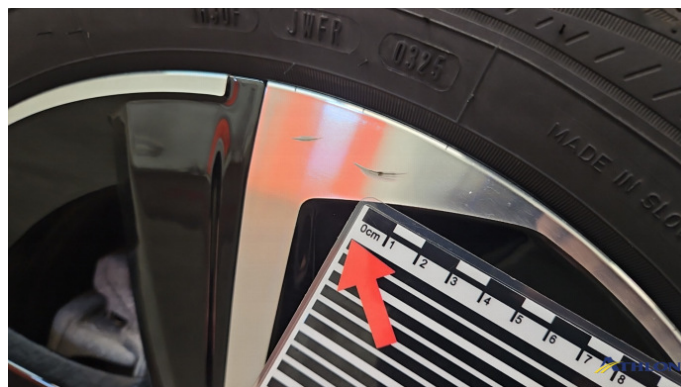
6. Felge Hinten - Rechts Kratzer