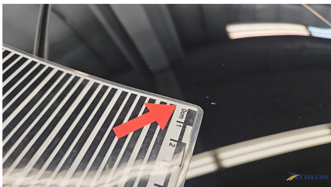
3. Dach Steinschlag