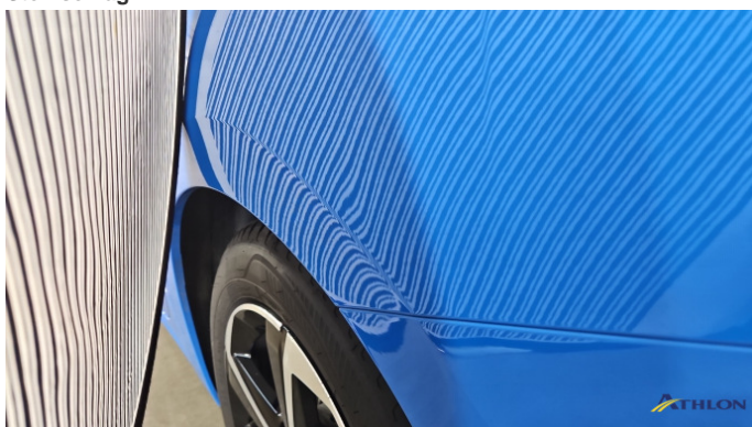
4. Seitenwand - Hinten - Links Verformt (leicht)