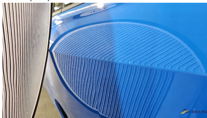
4. Seitenwand - Hinten - Links Verformt (leicht)