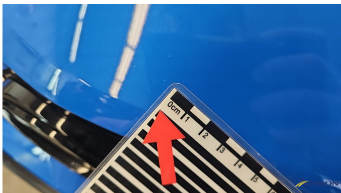
1. Stoßfänger Vorne Steinschlag