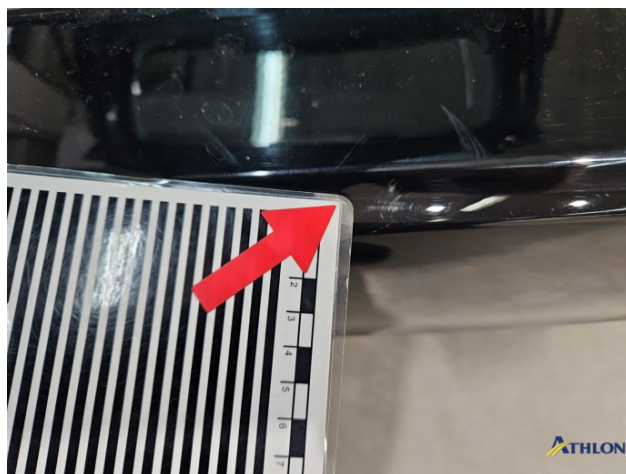
5. Stoßfänger Hinten Kratzer