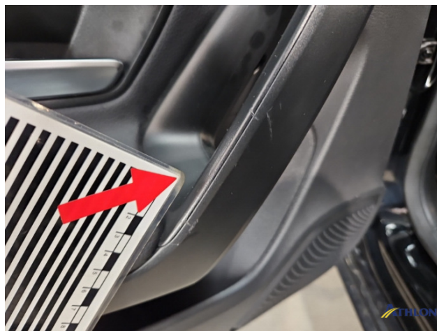
6. Türverkleidung Hinten - Links Gebrauchsspuren