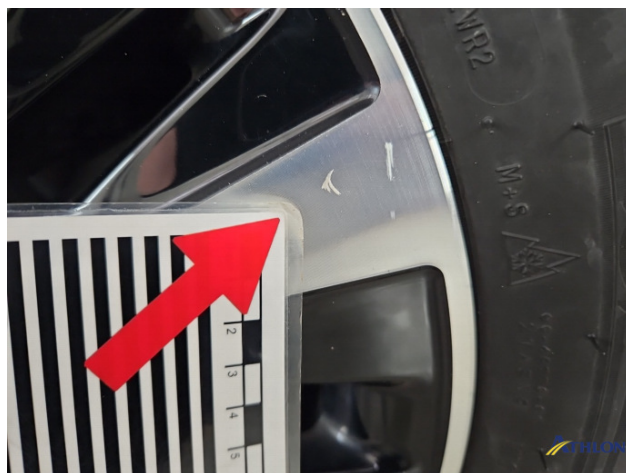
3. Felge Hinten - Links Kratzer