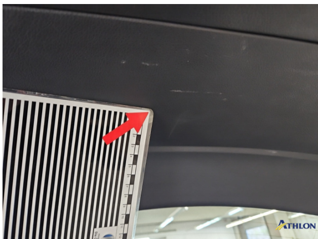
8. Heckdeckelverkleidung Gebrauchsspuren