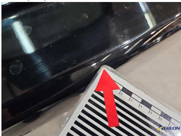
5. Stoßfänger Hinten Kratzer