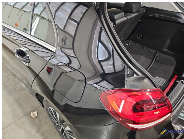
9. Fahrzeug Nachlackiert