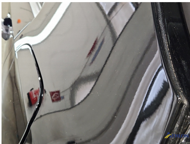
9. Fahrzeug Nachlackiert