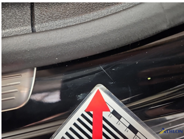
2. Türeinstieg Vorne - Links Kratzer