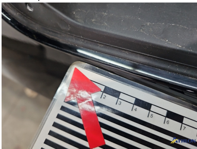
9. Fahrzeug Nachlackiert