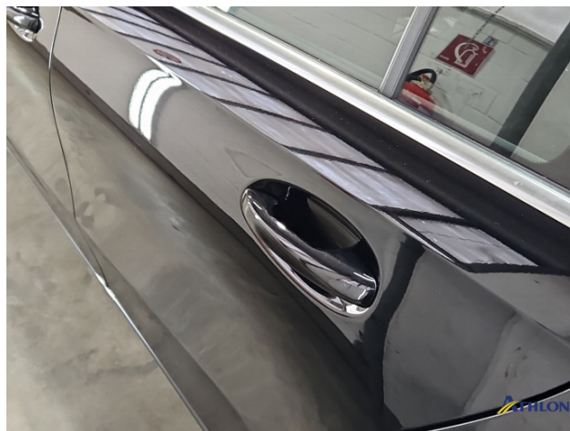
9. Fahrzeug Nachlackiert