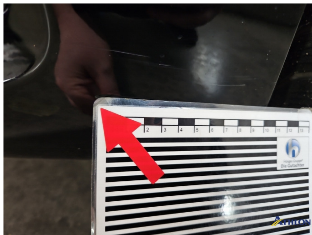
1. Stoßfänger Vorne Kratzer Ab 60mm