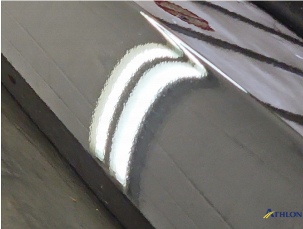
9. Fahrzeug Nacklackiert