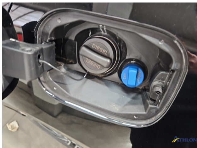
9. Fahrzeug Nachlackiert