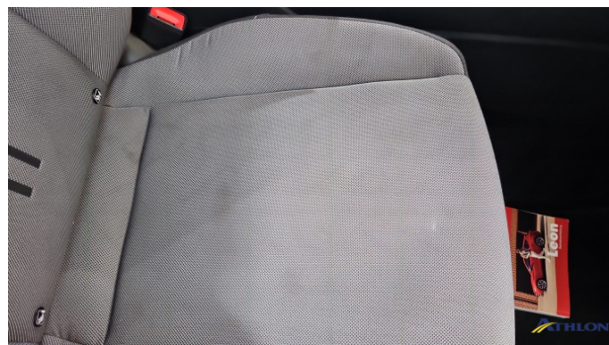
7. Sitz - Vorne - Rechts Verschmutzt (mittel)