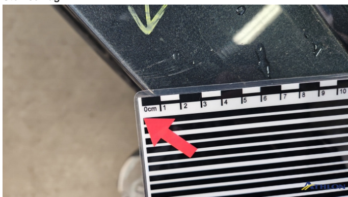
3. Stoßfänger Hinten Kratzer