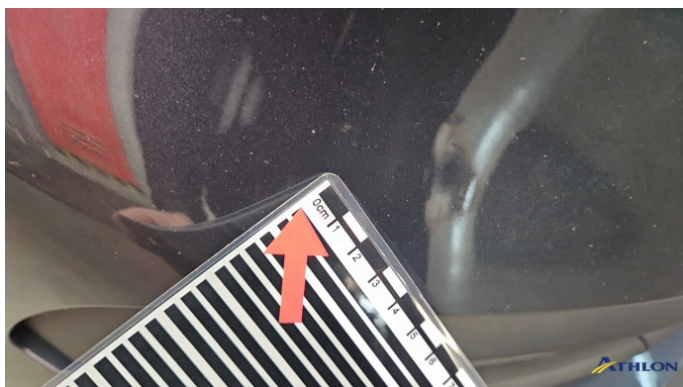
1. Kotflügel Vorne - Links Steinschlag