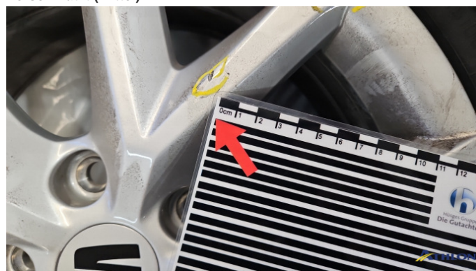
8. Sommerfelge 1 Kratzer