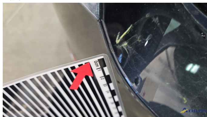
3. Stoßfänger Hinten Kratzer