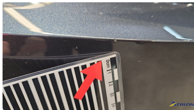
1. Kotflügel Vorne - Links Steinschlag