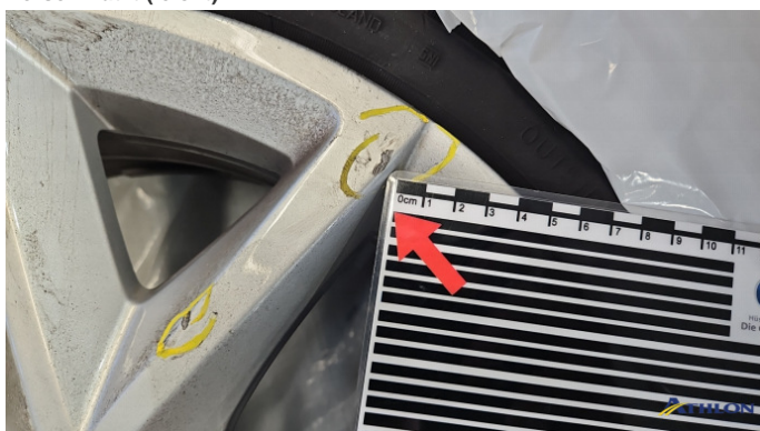
8. Sommerfelge 1 Kratzer