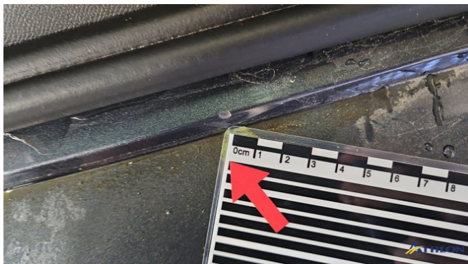
3. Stoßfänger Hinten Kratzer