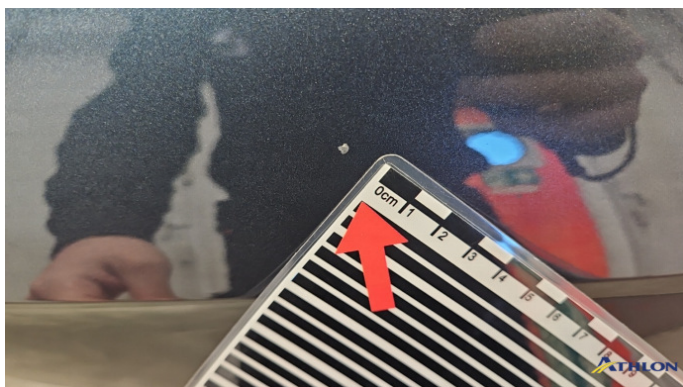
5. Kotflügel Vorne - Rechts Verschmutzt (leicht)