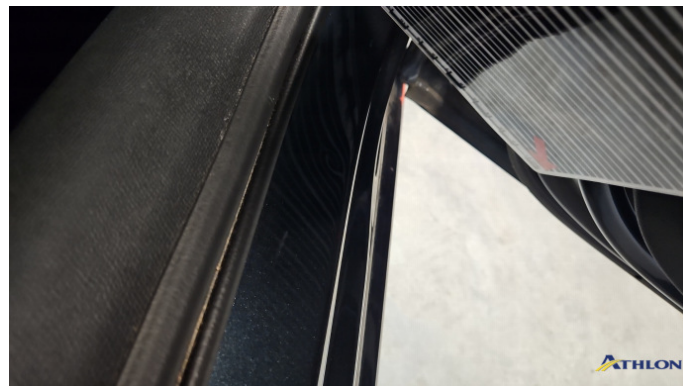
4. Türeinstieg Hinten - Rechts Verformt (leicht)