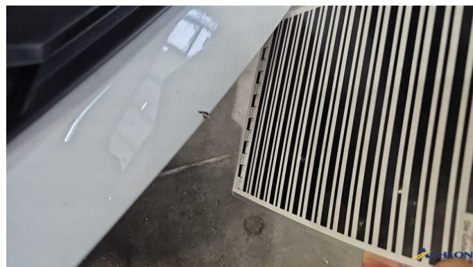
1. Stoßfänger Vorne Verformt (leicht)