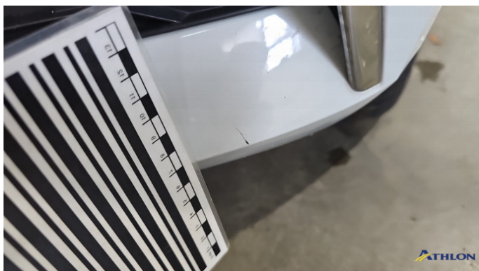
2. Stoßfänger Vorne Kratzer