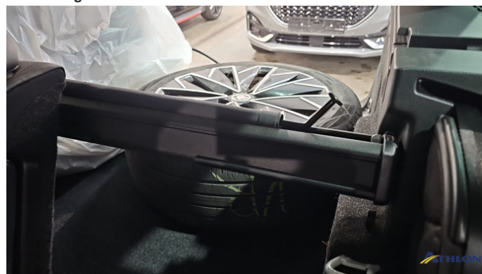
11. Zubehörausstattung Kratzer