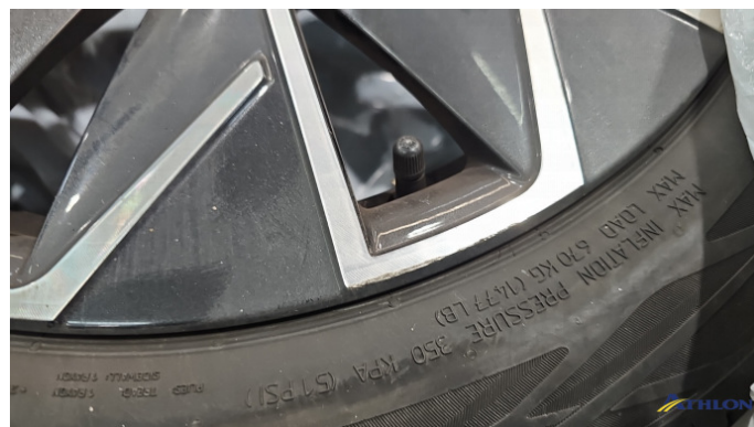
8. Sommerfelge 2 Kratzer