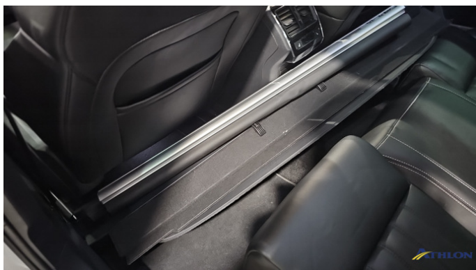
11. Zubehörausstattung Kratzer