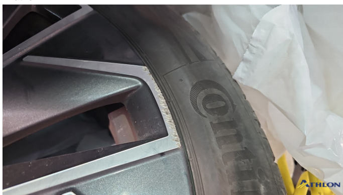
9. Sommerfelge 3 Kratzer