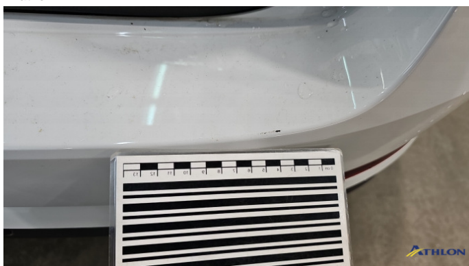
3. Stoßfänger Hinten Kratzer