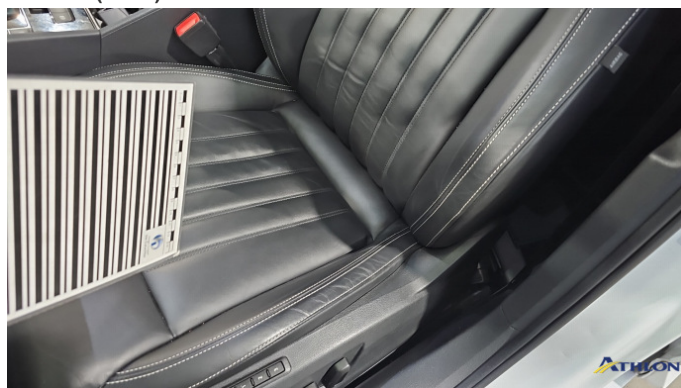
6. Sitz - Vorne - Links: Kissen Gebrauchsspuren