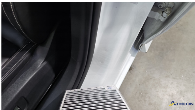
5. Türeinsteig Vorne - Links Verformt (leicht)