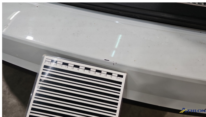
3. Stoßfänger Hinten Kratzer