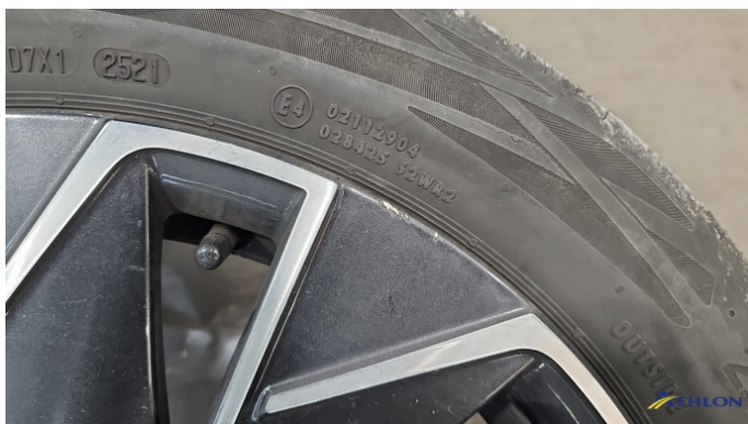
7. Sommerfelge 1 Kratzer