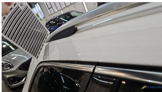
4. Dachrahmen - Rechts Verformt (leicht)