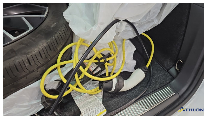
10. Ladekabel In Ordnung