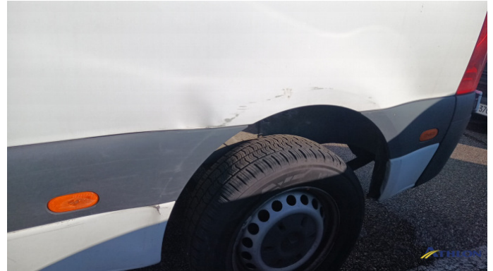
3. porta posteriore - sinistra Graffio/Rigature