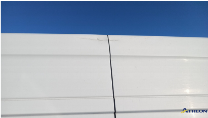
3. porta posteriore - sinistra Graffio/Rigature