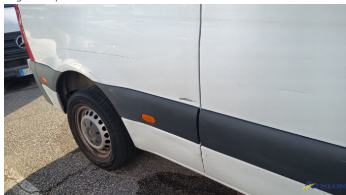
1. porta posteriore - destra Graffio/Rigature