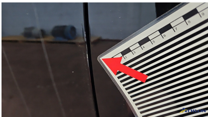
2. Tür Vorne - Links Kratzer