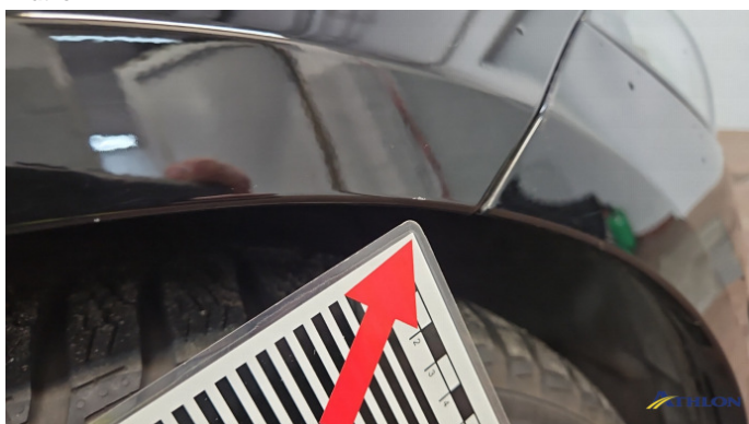
4. Kotflügel Vorne - Rechts Kratzer