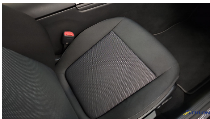
5. Sitz - Vorne - Rechts: Kissen Verschmutzt (leicht)