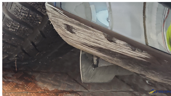
1. Stoßfänger Vorne Kratzer Ab 60mm