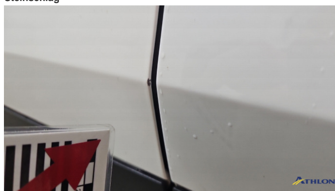
3. Tür Vorne - Links Kratzer