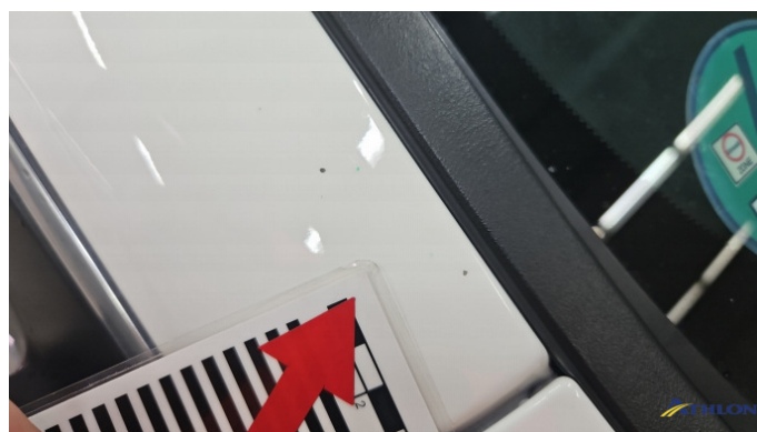
5. A-Säule Vorne - Rechts Steinschlag