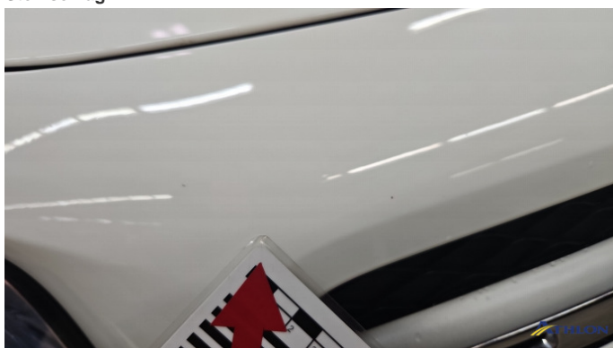
2. Stoßfänger Vorne Steinschlag