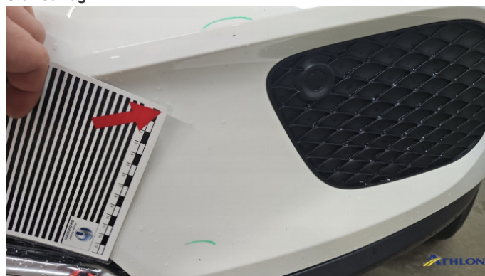
2. Stoßfänger Vorne Steinschlag