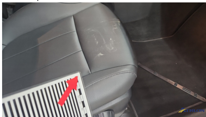
8. Sitz Vorne Rechts Verschmutzt (leicht)