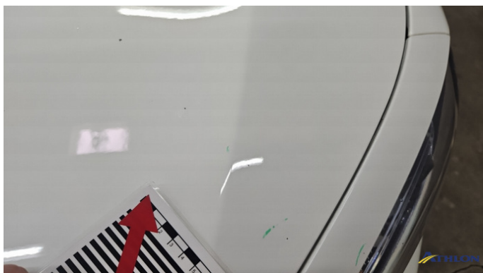
1. Motorhaube Steinschlag