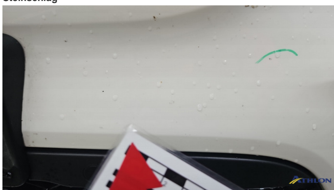
2. Stoßfänger Vorne Steinschlag