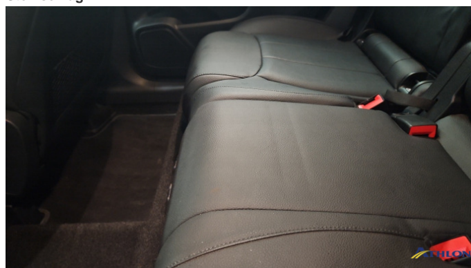
7. Sitzbank Hinten Gebrauchsspuren