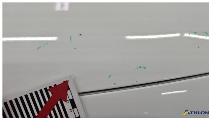
1. Motorhaube Steinschlag