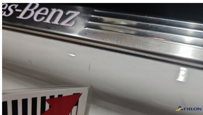
4. Türeinstieg Vorne - Links Kratzer