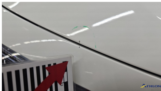
1. Motorhaube Steinschlag