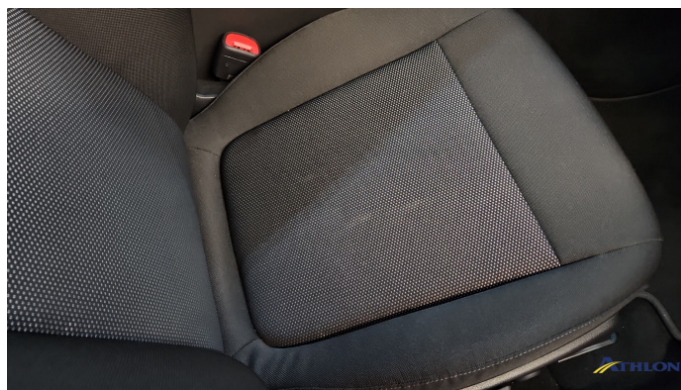
6. Sitz - Vorne - Rechts: Kissen Verschmutzt (leicht)