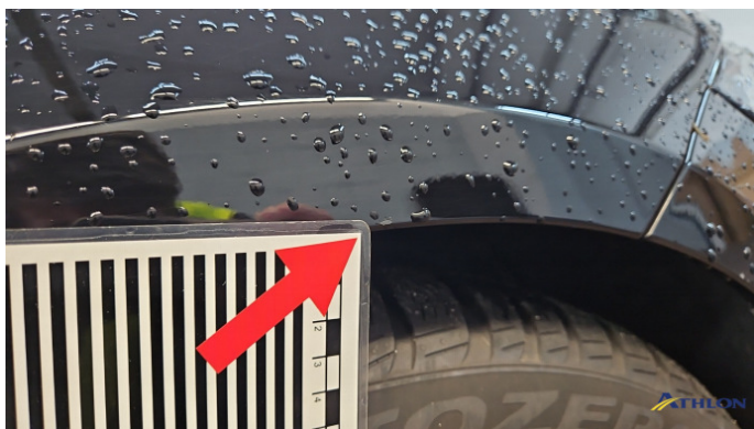
5. Kotflügel Vorne - Rechts Kratzer