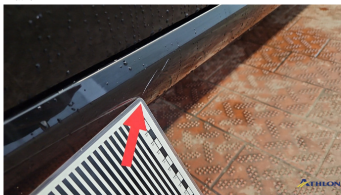
4. Schweller - Rechts Kratzer