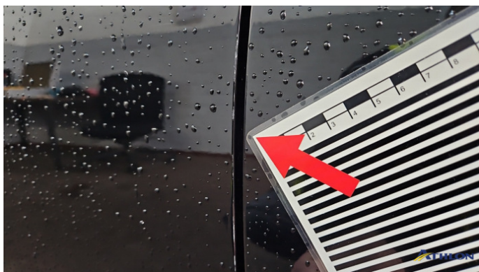
2. Tür Vorne - Links Kratzer