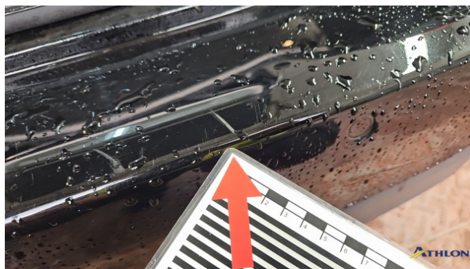
3. Stoßfänger Hinten Kratzer