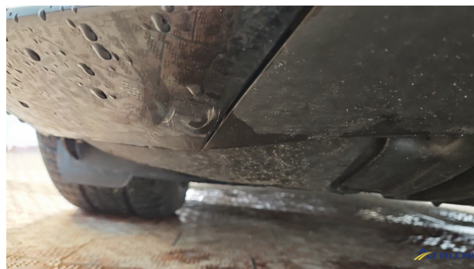
1. Stoßfänger Vorne Kratzer