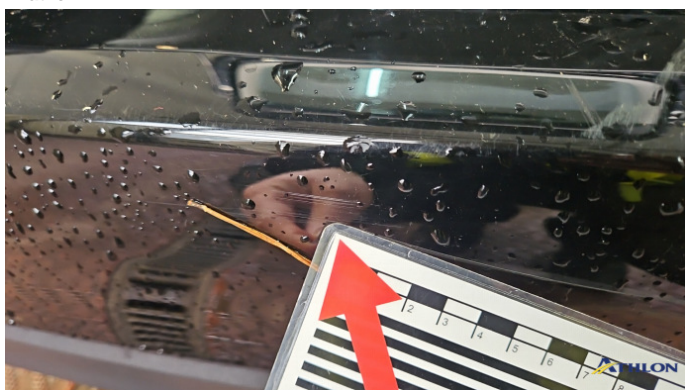
3. Stoßfänger Hinten Kratzer