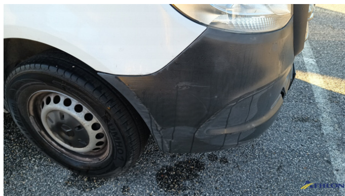
3. spoiler anteriore Graffio/Rigature