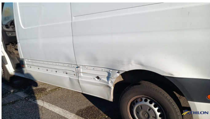
2. porta posteriore - sinistra Graffio/Rigature