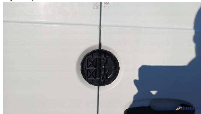
1. portello posteriore Rotto