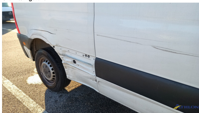
4. porta posteriore - destra Graffio/Rigature