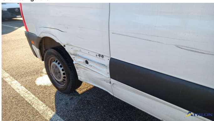
4. porta posteriore - destra Graffio/Rigature