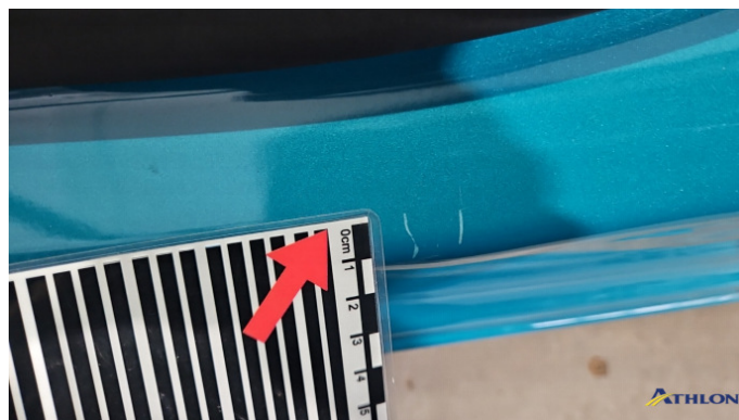
2. Türeinstieg Vorne - Links Kratzer