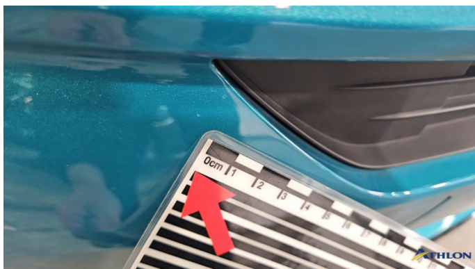
1. Stoßfänger Vorne Steinschlag