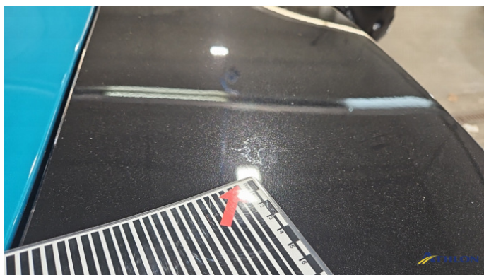
3. Heckklappe Umweltschaden