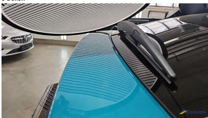
4. Heckklappe 3 Dellen