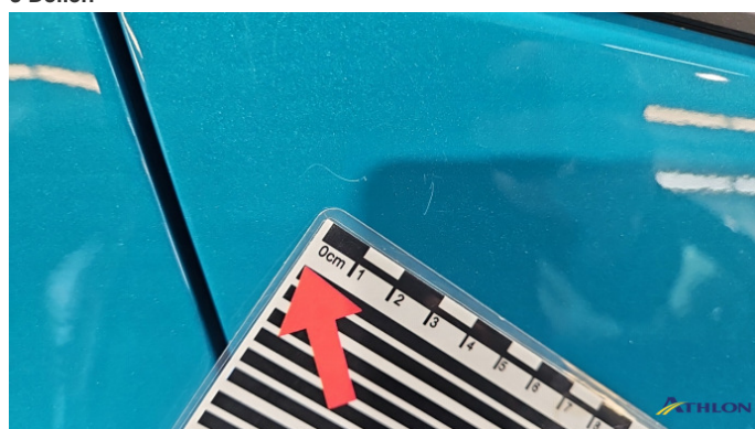
5. Tür Hinten - Rechts Kratzer