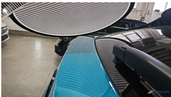
4. Heckklappe 3 Dellen