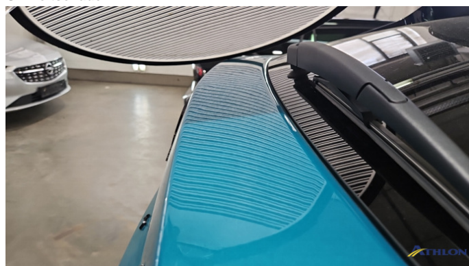
4. Heckklappe 3 Dellen