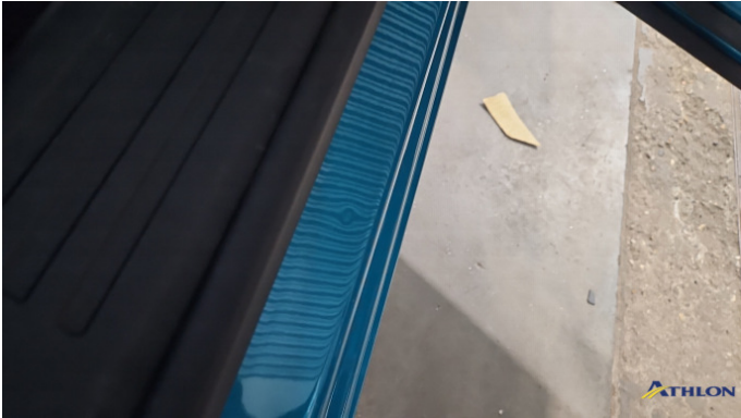
6. Türeinstieg Vorne - Rechts Verformt (leicht)