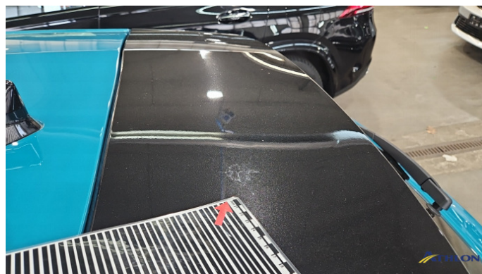
3. Heckklappe Umweltschaden