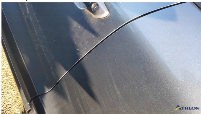
8. porta anteriore - sinistra Graffi superficiali