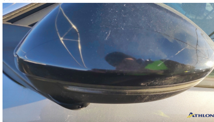
7. retrovisore esterno scatola - sinistro Graffi superficiali