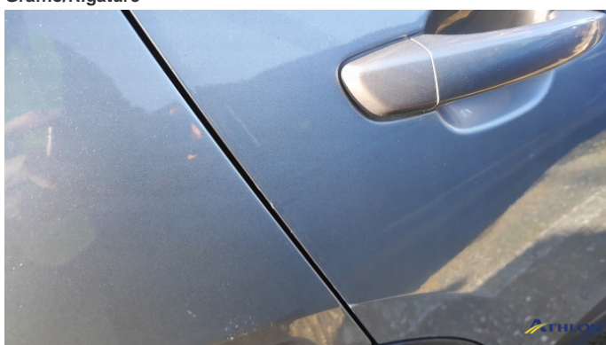
2. porta posteriore - destra Graffi superficiali