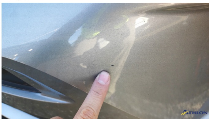
6. paraurti anteriore Graffi superficiali