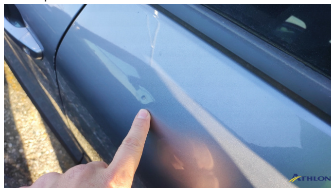
9. porta posteriore - sinistra 2 ammaccature