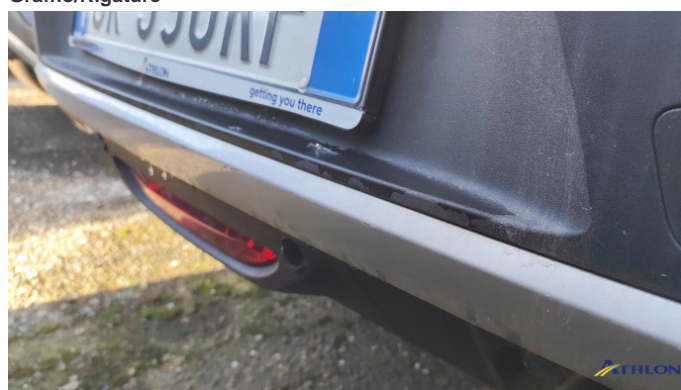
1. paraurti posteriore Graffio/Rigature