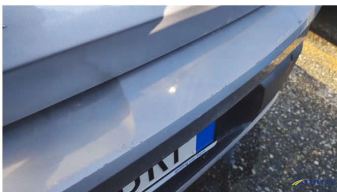
1. paraurti posteriore Graffio/Rigature