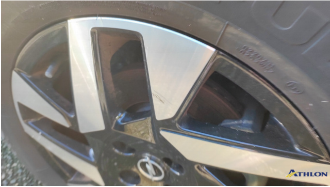
10. cerchione anteriore - destra Graffio/Rigature