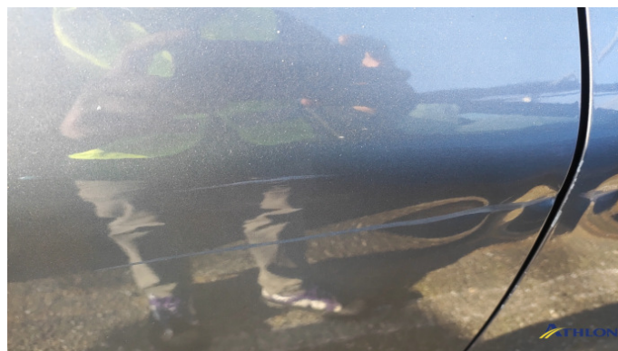
5. porta posteriore - destra 3 ammaccature