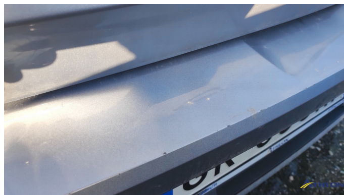
1. paraurti posteriore Graffio/Rigature