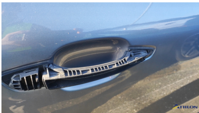
4. porta anteriore - destra Mancante