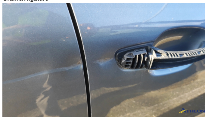
3. porta anteriore - destra 3 ammaccature