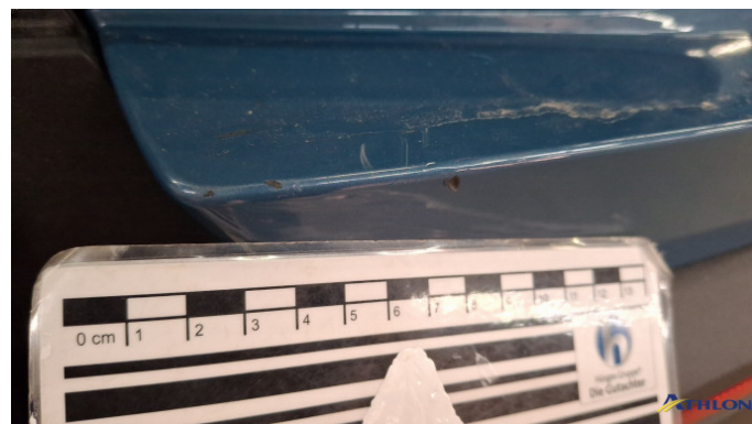
1. Stoßfänger Hinten Gebrauchsspuren