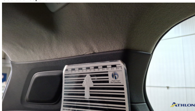
5. Dachhimmel Gebrauchsspuren