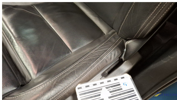
7. Fahrersitz Gebrauchsspuren