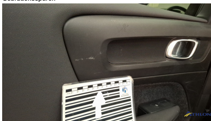
6. Türverkleidung Vorne - Links Kratzer