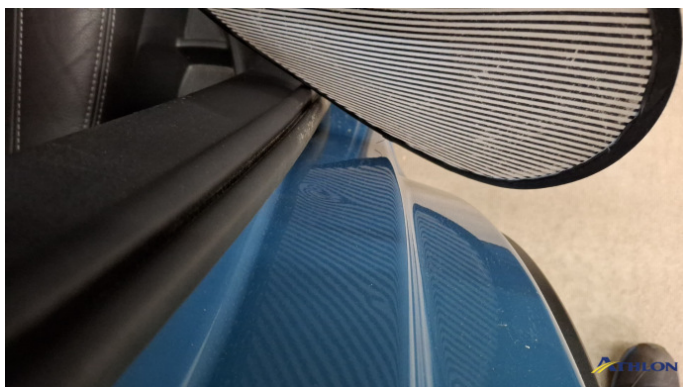
2. Türeinstieg Hinten - Rechts Verformt (leicht)