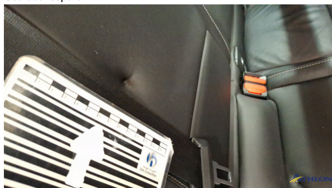
8. Rücksitze Gebrauchsspuren