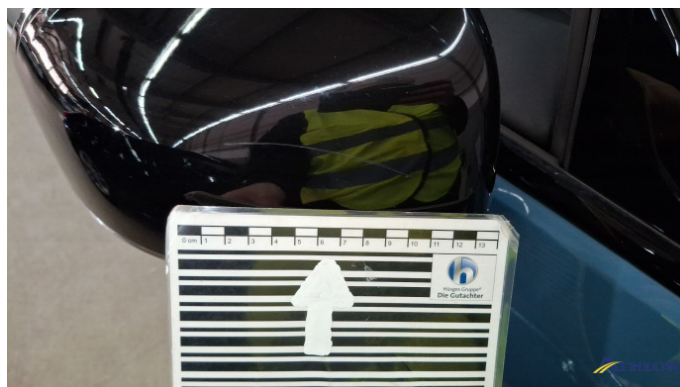
3. Außenspiegel Gehäuse - Rechts Gebrauchsspuren