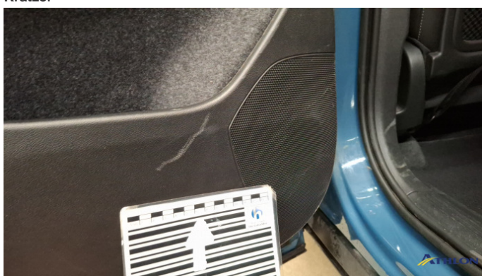
6. Türverkleidung Vorne - Links Kratzer