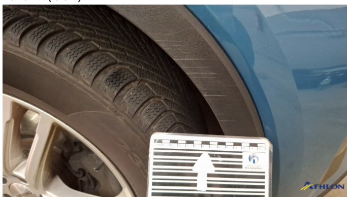
4. Kotflügel Vorne - Rechts Kratzer