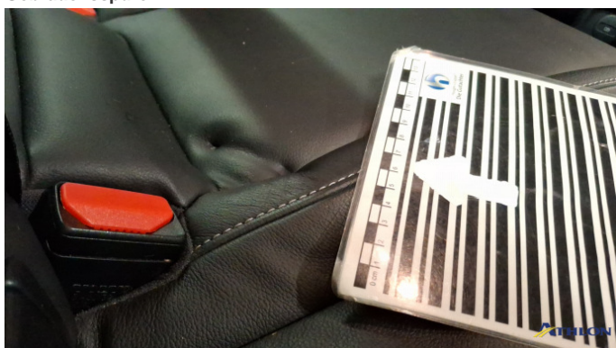
8. Rücksitze Gebrauchsspuren