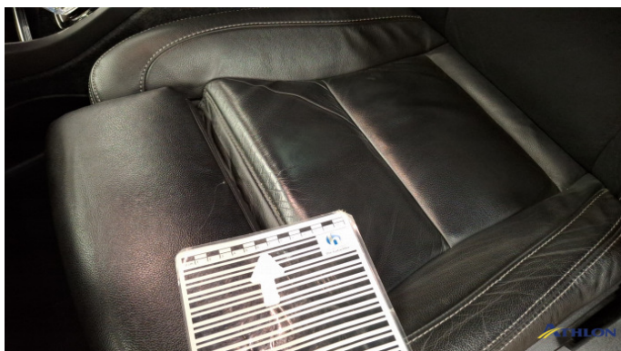
7. Fahrersitz Gebrauchsspuren