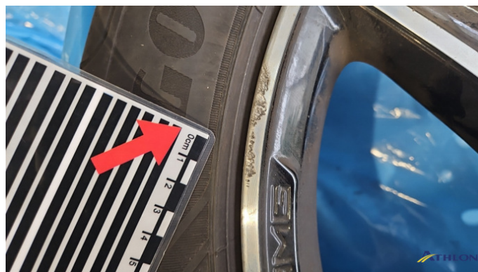
22. Sommerfelge 1 Vorne Kratzer