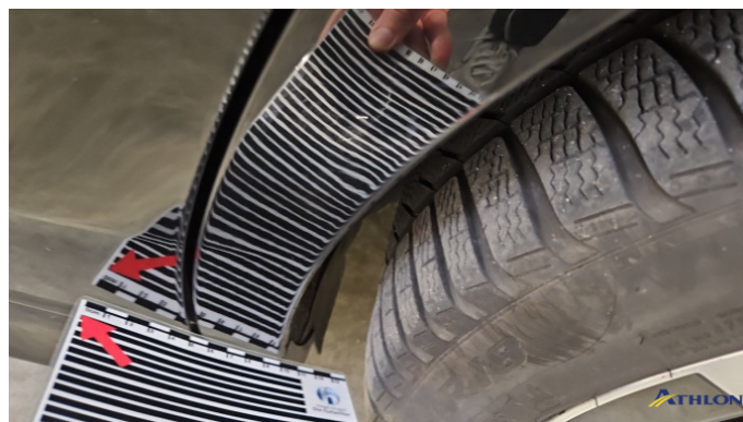
13. Seitenwand - Hinten - Links 1 Delle