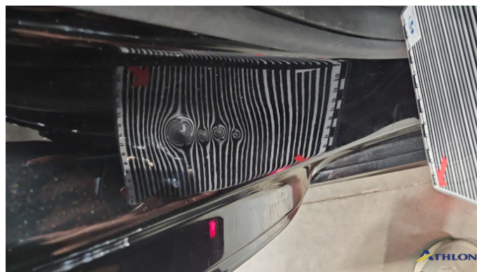
16. Türeinstieg Hinten - Rechts Verformt (leicht)