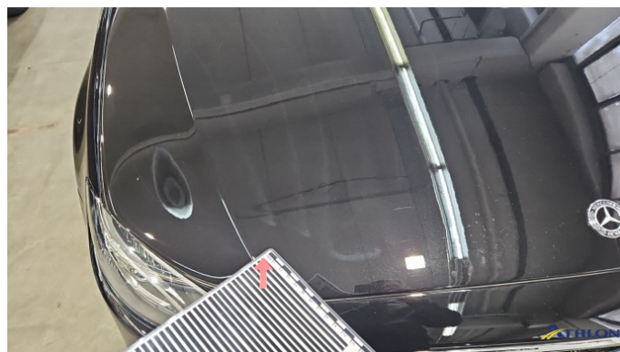
3. Motorhaube Kratzer