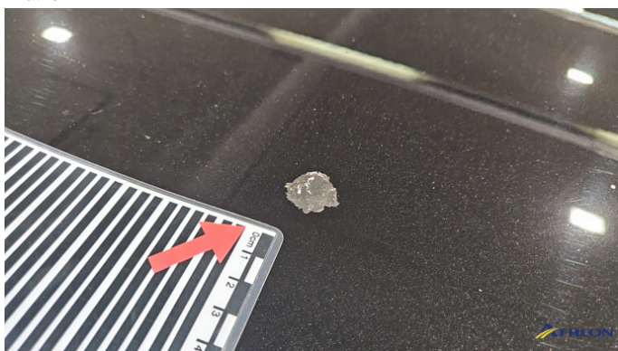
10. Dach Verschmutzt (leicht)