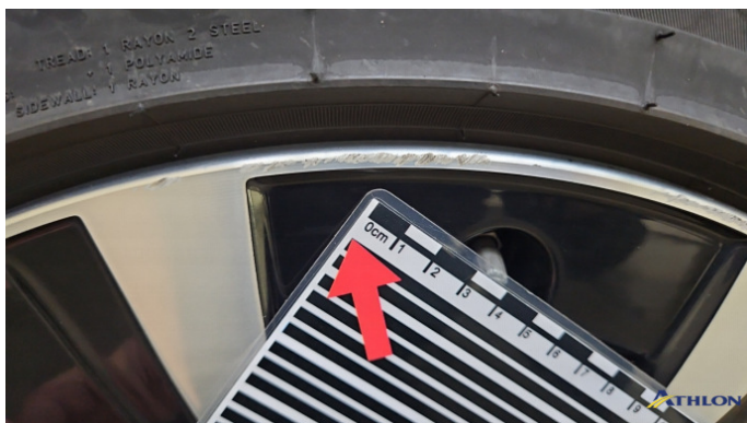
12. Felge Hinten - Links Kratzer