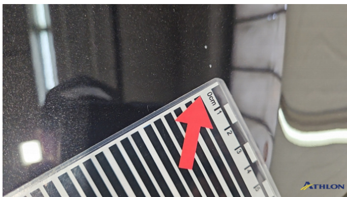
2. Motorhaube Steinschlag