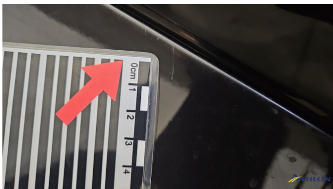
8. Schweller - Links Kratzer