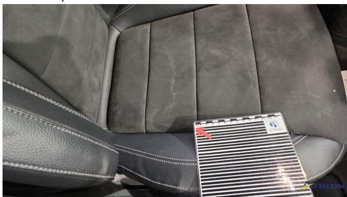
24. Sitz - Vorne - Rechts Verschmutzt (mittel)