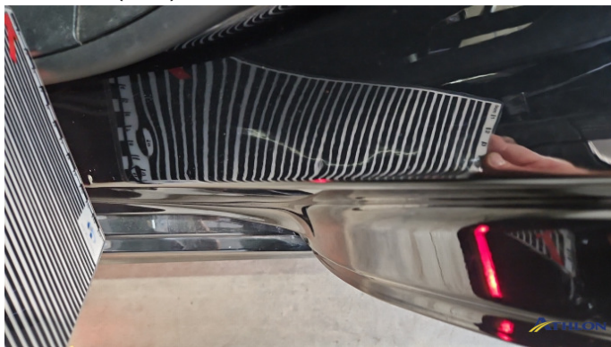
11. Türeinstieg Hinten - Links Verformt (leicht)