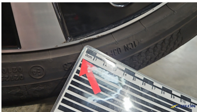
21. Felge Vorne - Rechts Kratzer