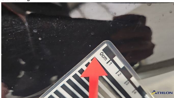
4. Stoßfänger Vorne Steinschlag