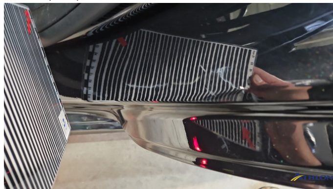
11. Türeinstieg Hinten - Links Verformt (leicht)