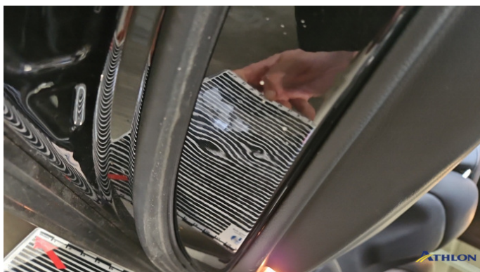
17. Tür Hinten - Links Verformt (leicht)