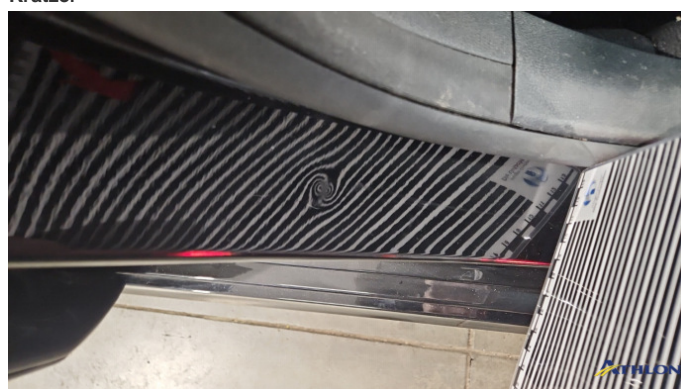
20. Türeinstieg Vorne - Rechts Verformt (leicht)