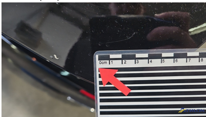
15. Heckklappe Kratzer