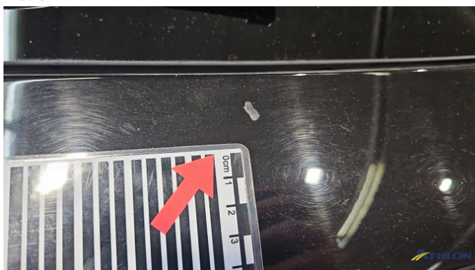
14. Heckklappe Verschmutzt (leicht)