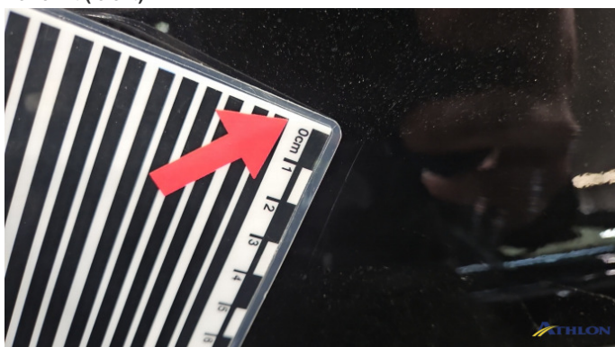
18. Tür Hinten - Rechts Kratzer