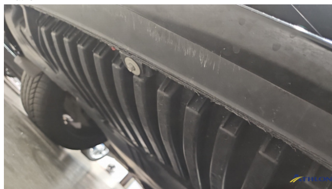
5. Stoßfänger Vorne Kratzer