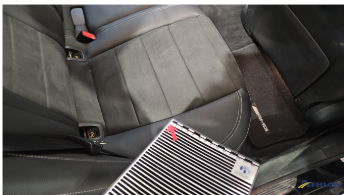
23. Sitzbank - Hinten Gebrauchsspuren