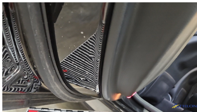
17. Tür Hinten - Links Verformt (leicht)