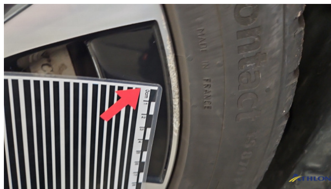
7. Felge Vorne - Links Kratzer