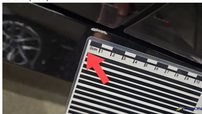
19. Schweller - Rechts Kratzer