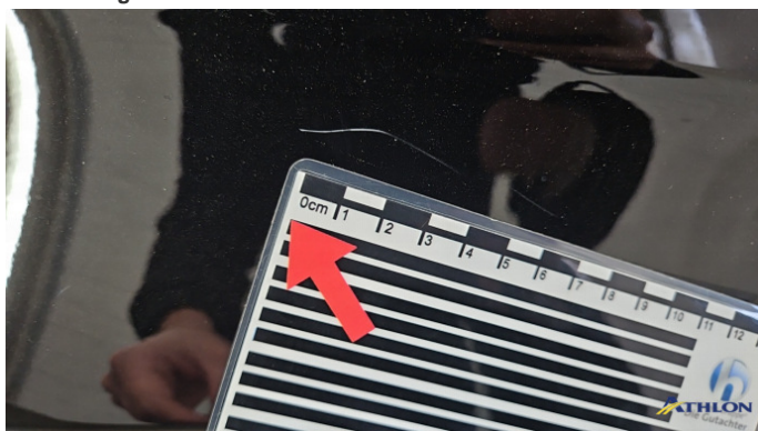
6. Kotflügel Vorne - Links Kratzer