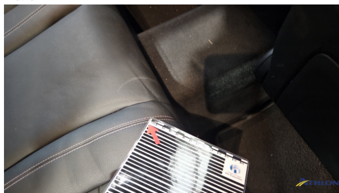
23. Sitzbank - Hinten Gebrauchsspuren