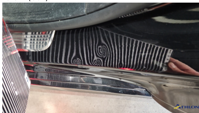
11. Türeinstieg Hinten - Links Verformt (leicht)