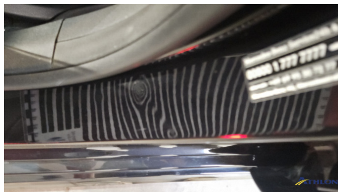
9. Türeinstieg Vorne - Links Verformt (leicht)