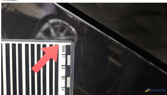
19. Schweller - Rechts Kratzer