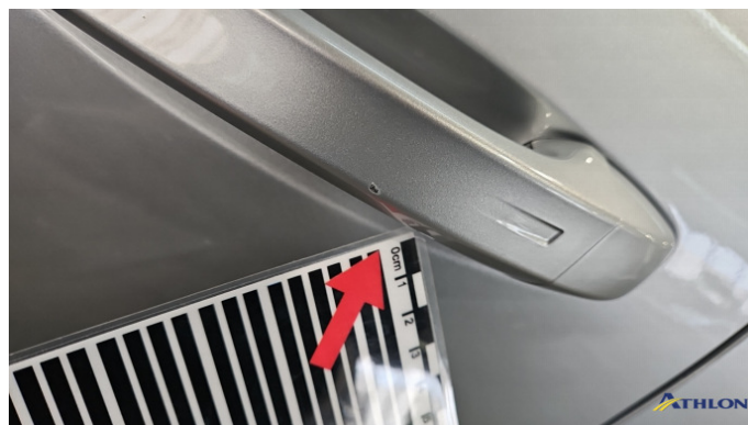
2. Außentürgriff Vorne - Links Kratzer