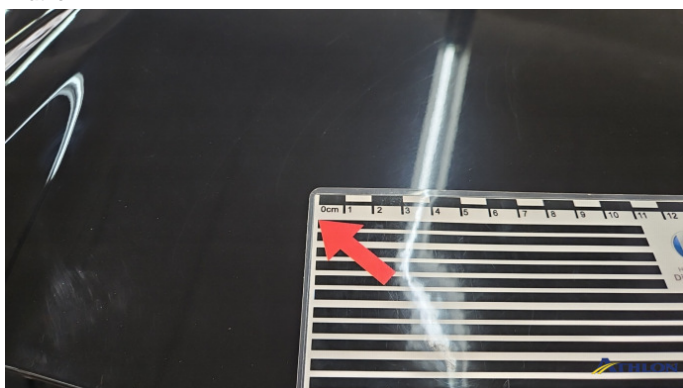
4. Heckklappe Kratzer