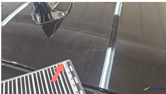
3. Dach Kratzer