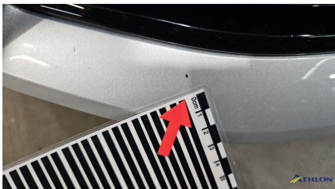
1. Stoßfänger Vorne Steinschlag