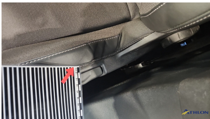
7. Sitz - Vorne - Links Gebrauchsspuren