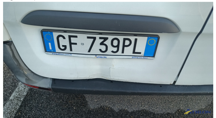
1. paraurti posteriore Graffio/Rigature