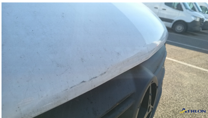
2. cofano Graffio/Rigature