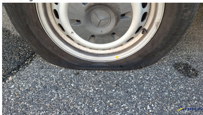
5. Pneumatico posteriore - destro Rotto