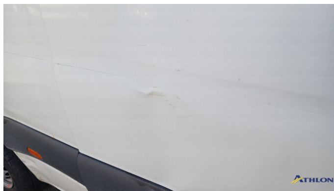
3. porta posteriore - destra Graffio/Rigature