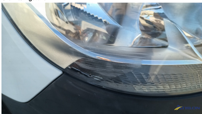
4. faro alogeno - destro Graffio/Rigature