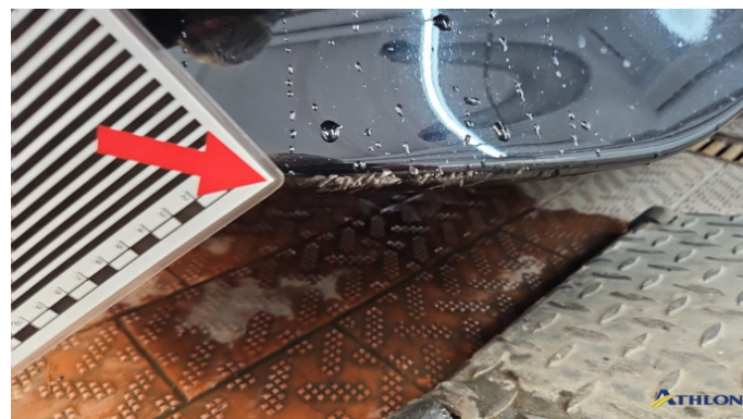
1. Stoßfänger Vorne Kratzer