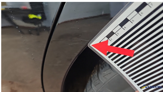
3. Seitenwand - Hinten - Links Kratzer