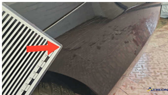
4. Stoßfänger Hinten Kratzer