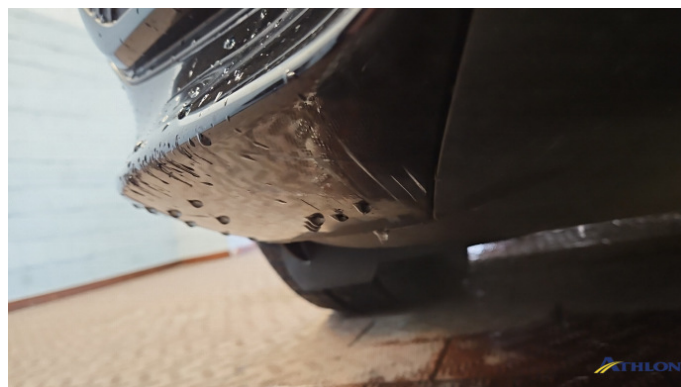
1. Stoßfänger Vorne Kratzer