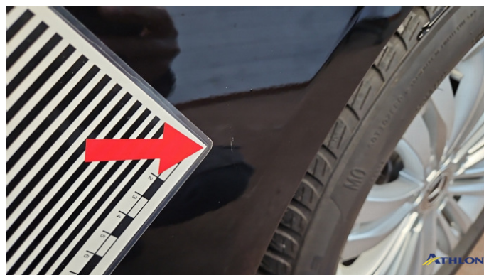
9. Kotflügel Vorne - Rechts Kratzer