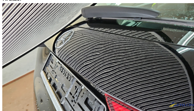
7. Heckklappe Verformt (leicht)