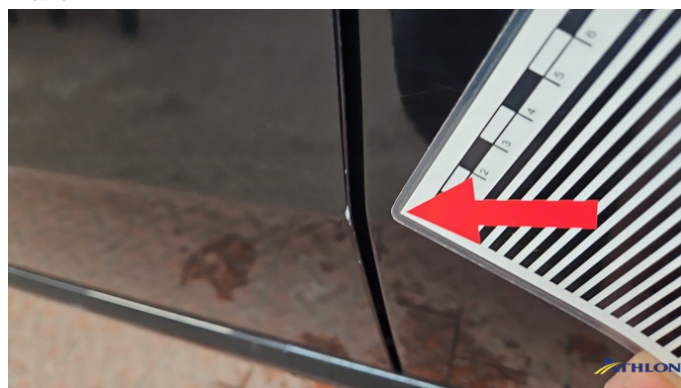
2. Tür Vorne - Links Kratzer