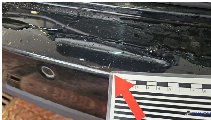
6. Stoßfänger Hinten Kratzer