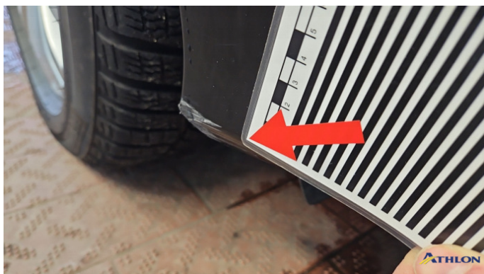
1. Stoßfänger Vorne Kratzer