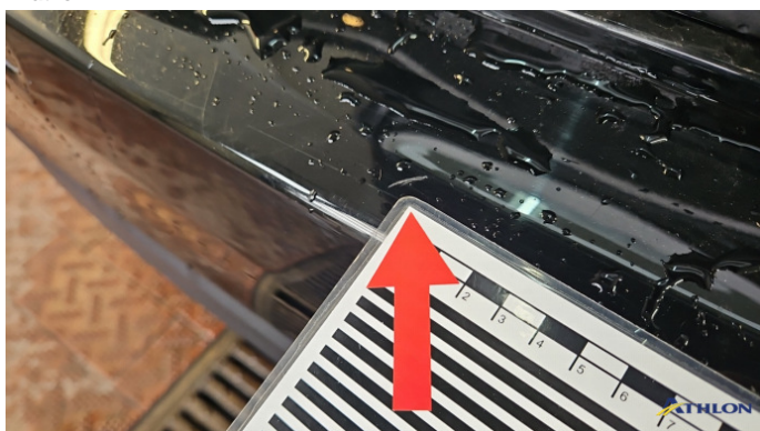
6. Stoßfänger Hinten Kratzer