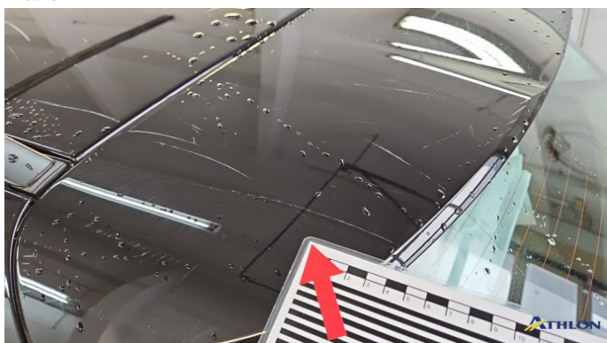
10. Heckklappe Kratzer