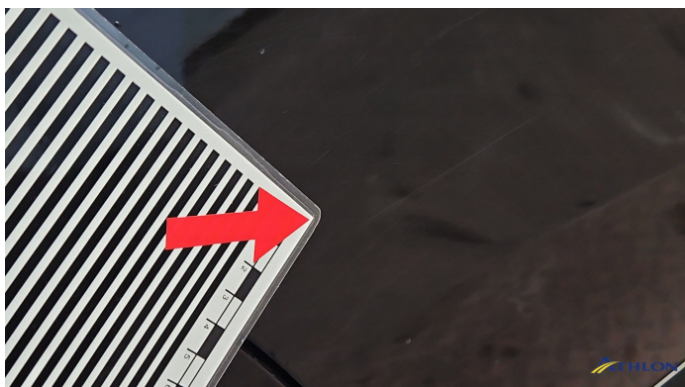
8. Tür Hinten - Rechts Kratzer