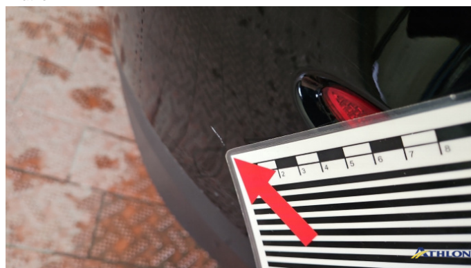
6. Stoßfänger Hinten Kratzer