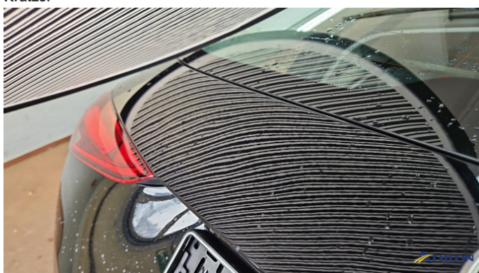
7. Heckklappe Verformt (leicht)