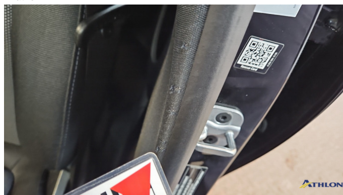
11. B-Säule Verkleidung Gebrauchsspuren