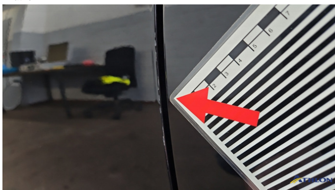
2. Tür Vorne - Links Kratzer