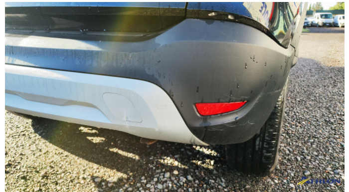
1. paraurti posteriore Graffio/Rigature