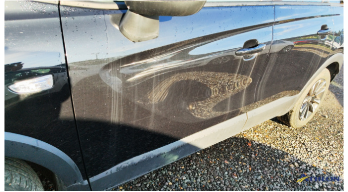
2. porta anteriore - sinistra Graffi superficiali