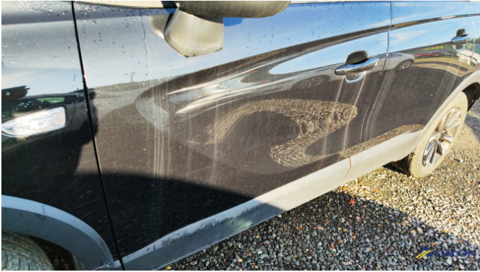
2. porta anteriore - sinistra Graffi superficiali