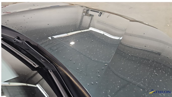
2. Motorhaube Verschmutzt (leicht)