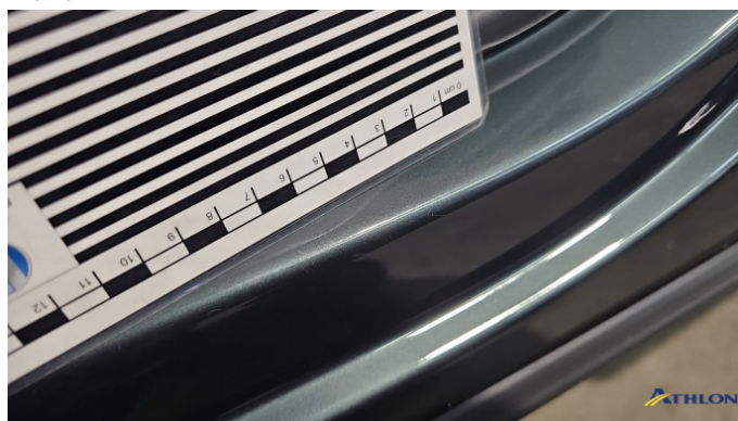
5. Türeinstieg Vorne - Links Kratzer