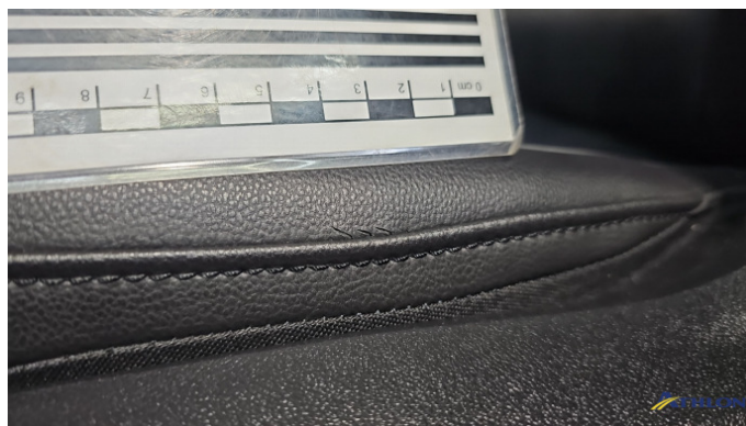
7. Sitz - Vorne - Links: Kissen Beschädigt