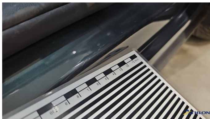
3. Türeinstieg Vorne - Rechts Kratzer