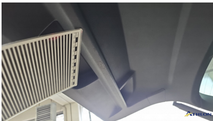
6. Heckdeckelverkleidung Gebrauchsspuren