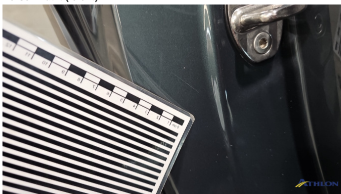
4. Türeinstieg Hinten - Rechts Kratzer