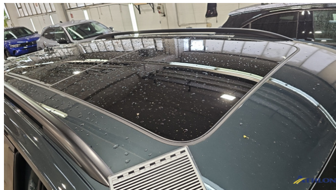
1. Dach Verschmutzt (leicht)