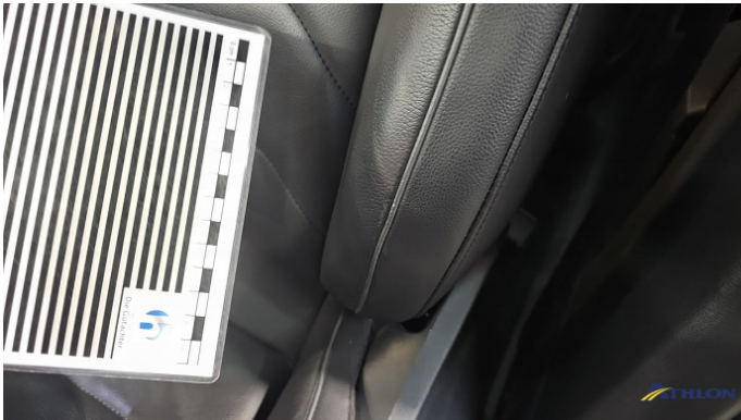
8. Sitz - Vorne - Links: Lehne Gebrauchsspuren